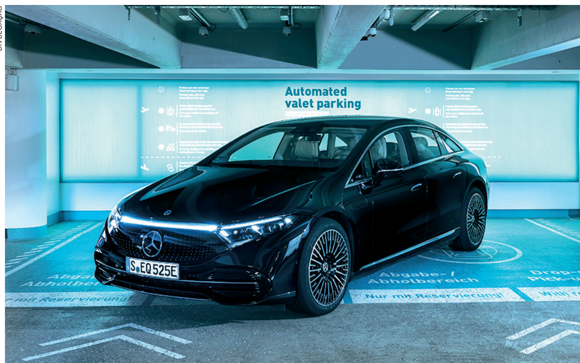
No Aeroporto de Stuttgart, o condutor poderá sair do veículo e enviá-lo para uma vaga de estacionamento pré-reservada apenas acessando um aplicativo

O sistema de estacionamento verifica se a rota para a vaga de estacionamento reservada está livre e que todos os outros requisitos técnicos foram atendidos. Nesse caso, o condutor recebe uma notificação no aplicativo confirmando que a infraestrutura inteligente assumiu o controle do veículo e ele pode deixar o estacionamento. O veículo automaticamente encontra o seu próprio caminho para a vaga de estacionamento. Quando o condutor deseja retirar seu automóvel do estacionamento, ele pode acioná-lo por meio do mesmo aplicativo e o veículo segue para uma área de retirada predeterminada.