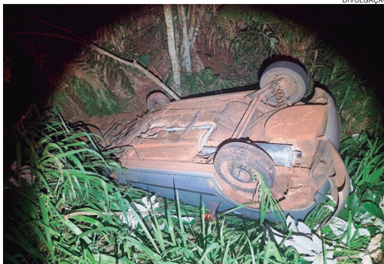
VEÍCULO ficou completamente destruído após o capotamento na rodovia. Os três ocupantes ficaram gravemente feridos

Equipes do Samu (Serviço de Atendimento Móvel de Urgência) foram acionadas e prestaram os primeiros socorros aos garotos, que foram conduzidos às pressas para um hospital em Umuarama.