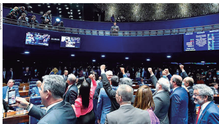
APROVAÇÃO da PEC da Transição é comemorada no Senado Federal

Para o relator, senador Alexandre Silveira (PSD-MG), o valor de R$ 145 bilhões é o mínimo necessário para fazer face “às necessidades