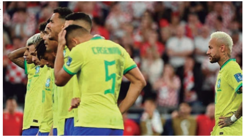
NEYMAR sentado no gramado é plena decepção por não ter passado das quartas na Copa e não quebrando o tabu

No 2º tempo da prorrogação, quem ficou com a posse de bola foi a Croácia. Afinal, seus jogadores precisavam atacar pela primeira vez no jogo inteiro. E