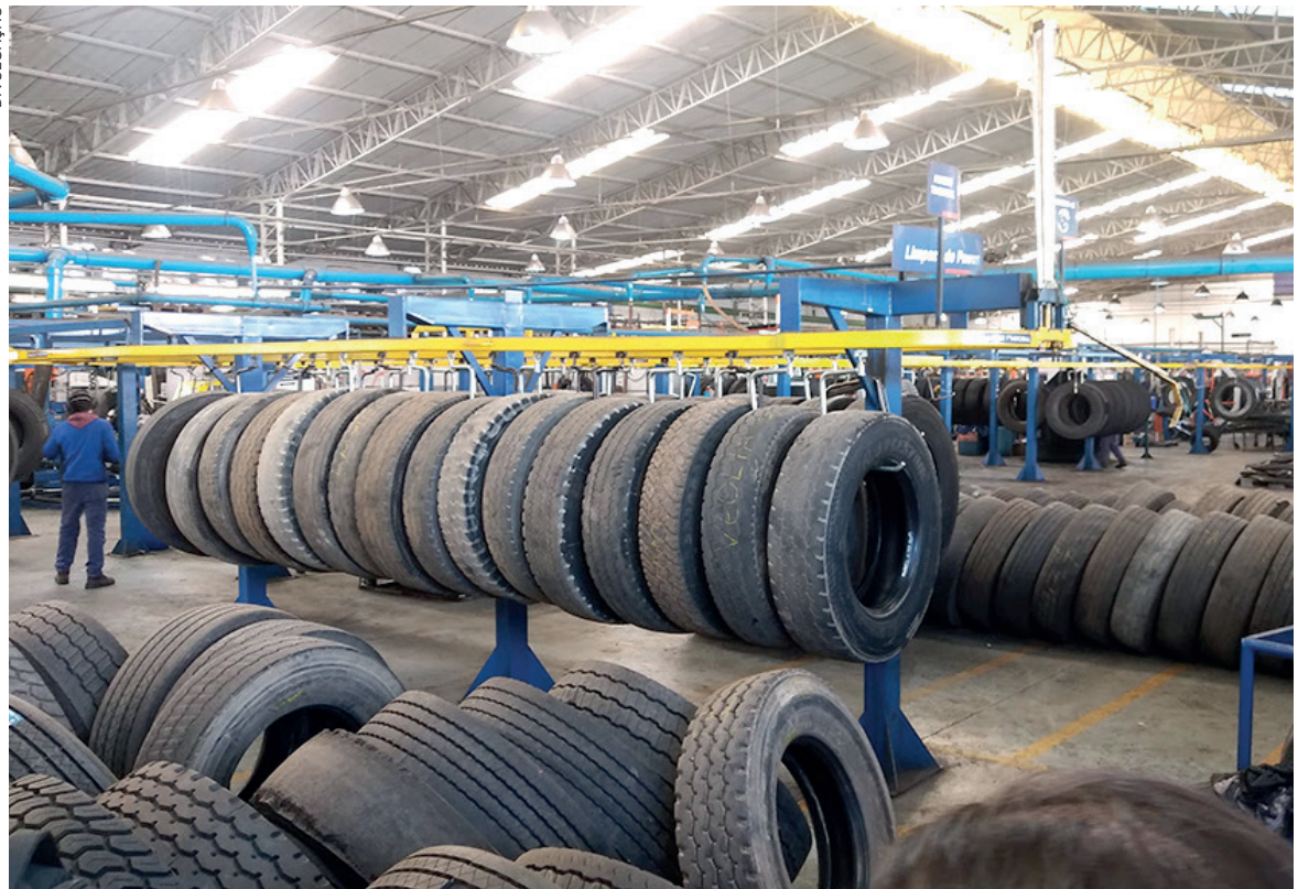
A produção de um pneu reformado evita o lançamento de 26 kgs de CO 2 na atmosfera, enquanto os pneus novos aumentam em 25% esse dano

o retorno da funcionalidade, com rendimento igual ou superior a banda de um pneu novo. Toda a reforma está aliada a processos tecnológicos e metodologias específicas de produção.