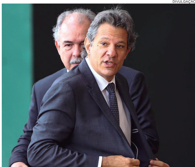
FUTURO ministro da Fazenda também promete revitalizar acordo com a União Européia

Em relação à discussão sobre o novo marco fiscal, o futuro ministro disse que o novo governo está