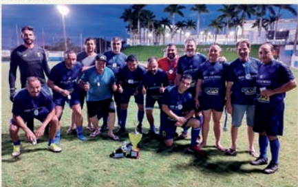
Categoria Quarentão Vice Campeões - Novo Teto Tintas