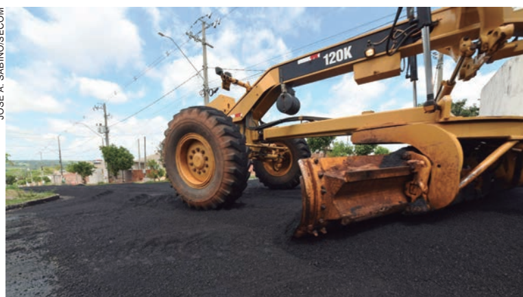
A Prefeitura recebeu 500 toneladas CBUQ e designou uma união de forças na execução da ação, que deve atingir não só a área central como os bairros