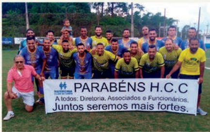
Vice Campeões: Clínica de Olhos Almeida