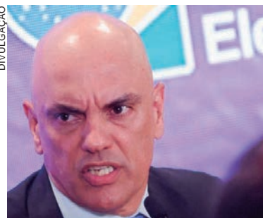
O presidente do TSE, Alexandre de Moraes, multou o PL em R$ 22,9 milhões por 'litigância de má-fé'

O presidente do TSE, Alexandre de Moraes, respondeu ao pedido dando 24 horas para que o PL incluísse no seu questionamento também a votação do primeiro turno, já que as urnas usadas eram as mesmas. No entanto, o partido, que elegeu governadores, senadores e 99 deputados federais no primeiro turno, manteve o