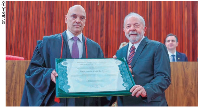
O presidente do TSE, ministro Alexandre de Moraes, entregou os diplomas para Lula e Alckmin

Em seguida, o presidente do TSE, ministro Alexandre de