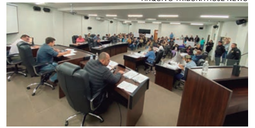
ARQUIVO TRIBUNA HOJE NEWS

A Lei Orçamentária Anual (LOA), tema do Projeto de Decreto Legislativo 101/2022, que estima a receita e fixa a despesa do Município, entrou ontem em