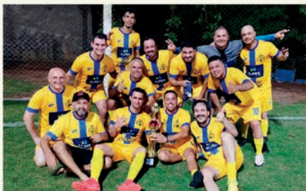
Categoria Quarentão Campeões: Sim+ Cred