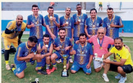
Campeões: Bons Amigos