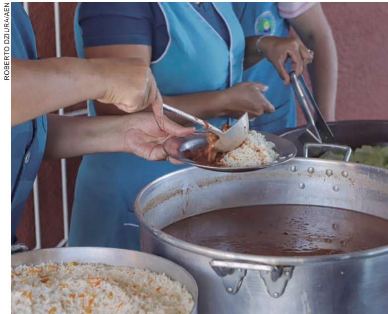
O percentual de produtos de base agroecológica e orgânicos na merenda era de 10,5%. Neste ano, deve ser superior a 18%, segundo a Fundepar

Repolho, beterraba, cenoura, alho, pães e sucos estão entre os produtos saudáveis oferecidos nas escolas. Em 2021, o percentual de produtos de base agroecológica e orgânicos na merenda era de 10,5%. Neste