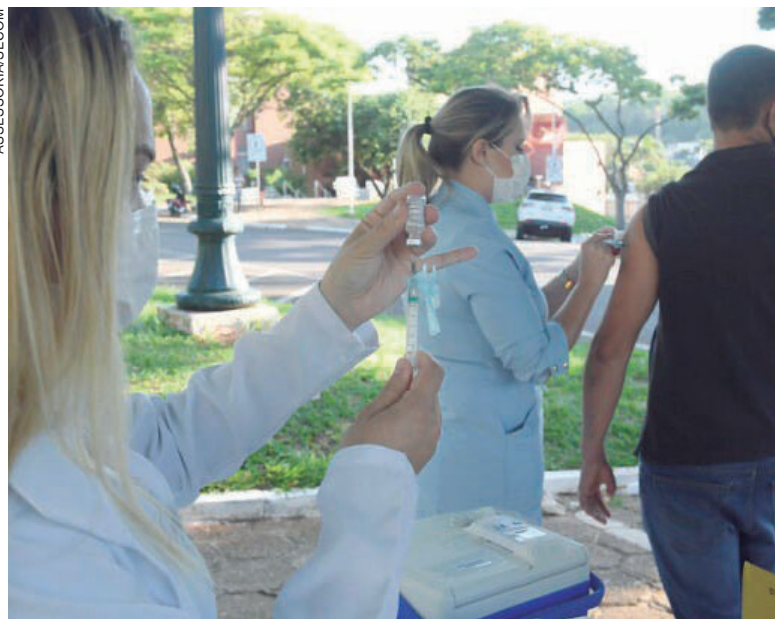
SÃO disponibilizadas hoje vacinas para crianças e adolescentes na UBS Centro de Saúde Escola e para todas as pessoas com mais de 12 anos nas outras UBSs

O aluno aprovado receberá certificado de conclusão chancelado pela Microsoft. Os cursos definidos são: trabalho com computador, criação de conteúdo digital, curso de Excel, Onedrive, programador de software, desenvolvedor de programas, analista de dados, analista de segurança de dados e engenheiro de dados, entre outros. Para fazer o curso é necessário ter 14 anos ou mais.