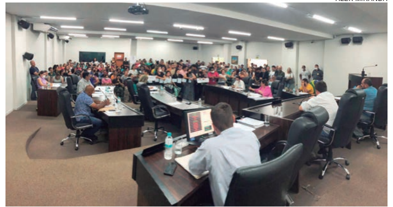
PROJETO de lei que trata do orçamento do município para 2023 não foi definido em segundo turno, após ser retirado da pauta ontem pela manhã

Os motivos da retirada da pauta do projeto que trata da Lei Orçamentária para 2023 não foram esclarecidos na Câmara, pois foi um pedido do Poder Executivo, autor da proposta. A reportagem tentou contato com a procuradoria jurídica da prefeitura, mas até o fechamento desta edição não teve retorno.