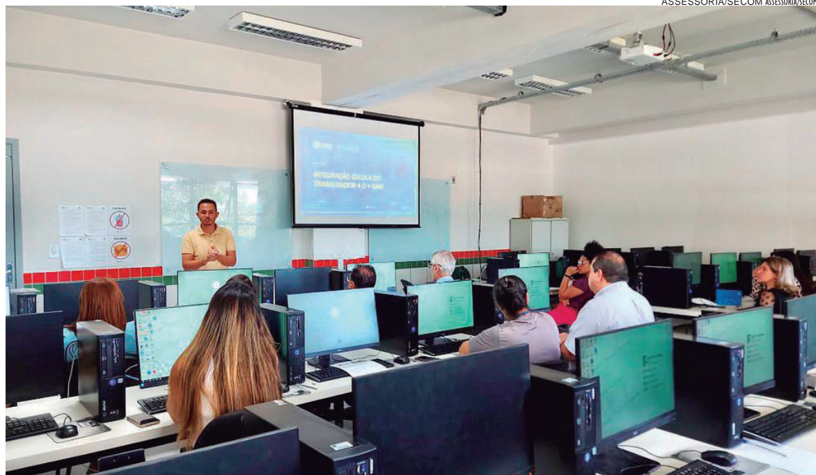
A plataforma traz 11 trilhas de aprendizagem que englobam 58 cursos de tecnologia em diferentes níveis

Uma parceria entre o Ministério de Trabalho e Previdência, a Secretaria de Estado da Justiça, Família e Trabalho (Sejuf) e a Microsoft, começou em todo o Estado com o curso de capacitação que oferta treinamento para o uso da plataforma Escola do Trabalhador 4.0, destinado aos profissionais da rede Sistema Nacional de Emprego (Sine). Em Umuarama, o sistema é operado através de convênio entre a Sejuf e a Prefeitura, por meio da Agência do Trabalho.