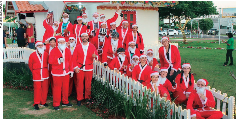
APÓS contornarem a praça Santos Dumont, os participantes acessaram a avenida Rio Branco e deram um ‘alô’ ao Papai Noel que estava na praça Hênio Romagnolli

O vereador retornou à Câmara Municipal de Umuarama nas eleições de 2020, quando foi eleito com 962 votos. Agora, como presidente da Casa Legislativa a partir de 2023, afirma que continuará com o seu trabalho parlamentar voltado às áreas da saúde, educação, emprego e desenvolvimento social, porém, com a incumbência de gerir a Câmara, em conformidade com os tantos atributos da função.