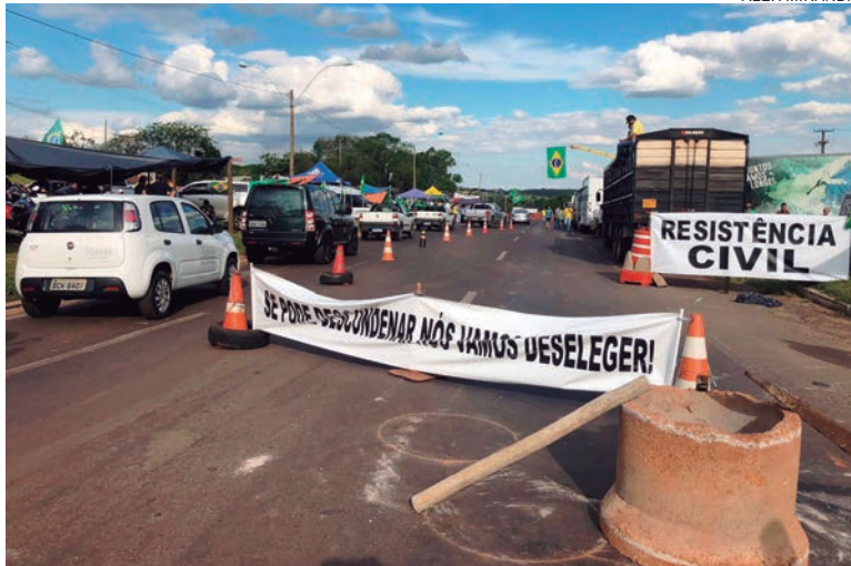
EM Umuarama duas pessoas receberam visitas dos agentes da Polícia Federal. Os nomes dos investigados não foram divulgados pela PF