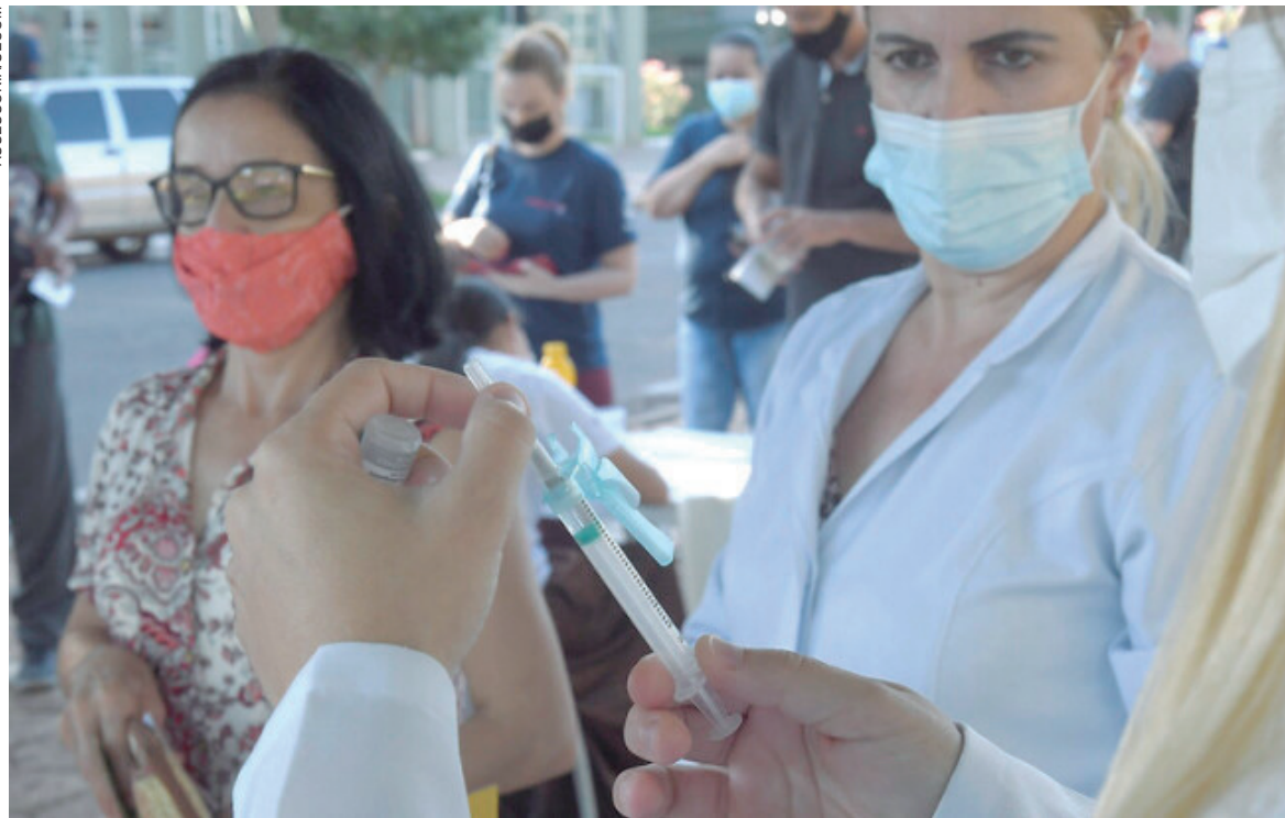
MESMO com os números de casos tendo aumentado nos últimos dias, o município continua classificado com bandeira verde pela Secretaria de Estado da Saúde

todos terão disponível álcool em gel para higienizar as mãos. “Sugerimos também