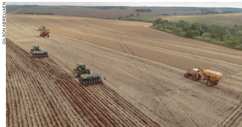
CERTIFICADOS de área livre de aftosa e de peste suína, junto a programas do governo, impactaram diretamente na ampliação do agronegócio nos últimos anos

Segundo o diretor-presidente do Ipardes, Marcelo Curado, o resultado pode ser explicado, em parte, pelo aumento dos investimentos no ramo agroindustrial. “Diante dos vultosos investimentos produtivos que continuam sendo realizados no Interior do Estado, principalmente no setor agroindustrial, não surpreende o avanço desses municípios, tornando o Estado mais equilibrado em termos econômicos”, afirma.