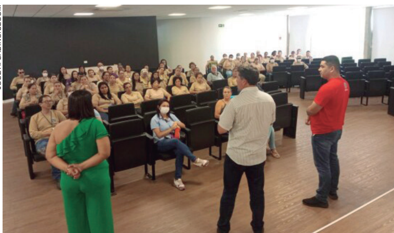
O valor devido a esses profissionais é um repasse feito pelo Ministério da Saúde a todos os municípios brasileiros por meio do FPM, porém, a maioria não efetivava o pagamento