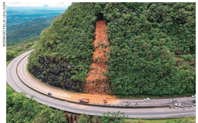
O cronograma irá depender das condições climáticas, com a continuidade das chuvas atrapalhando o andamento dos serviços

“Nossa prioridade neste momento é dar trafegabilidade à rodovia. Esses escorregamentos necessitam de obras complexas, mas já