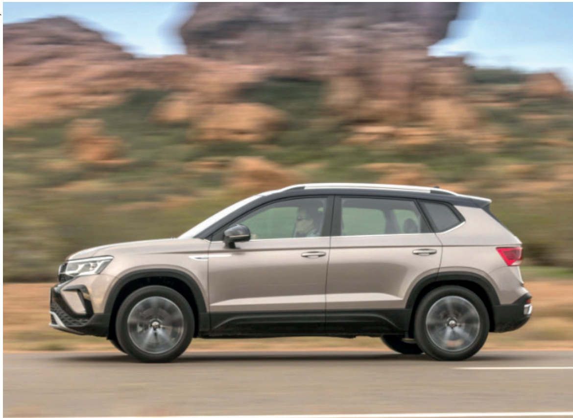
Com o Taos, a Volkswagen foi a primeira montadora a obter nota máxima em segurança no novo protocolo de testes do Latin NCAP (2020-2024)

e Assistente Traseiro de Saída, que alerta o condutor em manobras em marcha ré a baixa velocidade, como ao sair de uma vaga perpendicular, detectando outros veículos que cruzem a traseira, visando evitar uma colisão.