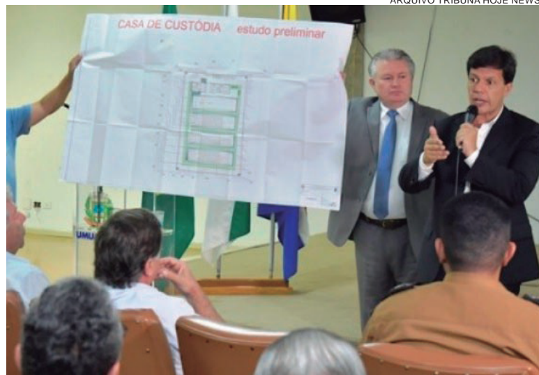
PROJETO da casa de custódia apresentado na Prefeitura e na Câmara antes da escolha do local onde será a construção

para esse tipo de construção. Hoje vivemos numa tranquilidade e sabemos que isso não