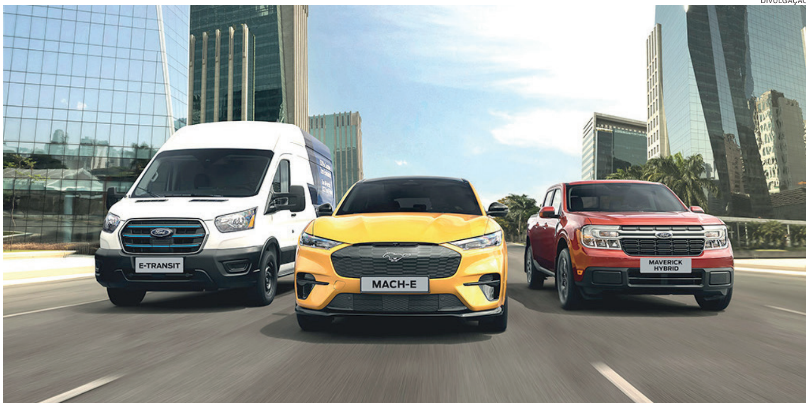
A Ford anuncia, dentro da sua agenda de eletrificação, a chegada de três produtos em 2023: a Maverick Hybrid, o Mustang Mach-E e a E-Transit

No segmento de veículos comerciais, um dos pilares do modelo de negócio da marca na região, a Transit foi a van que mais cresceu no