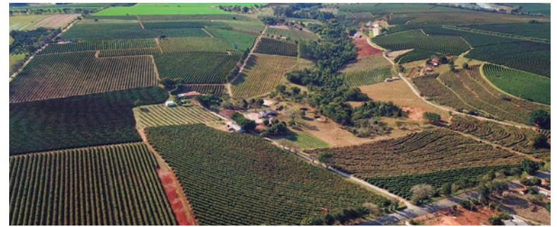
ENTRE as atividades econômicas, o destaque é o desempenho da agropecuária paranaense, que avançou 6% no confronto com o 2º trimestre

Entre as atividades econômicas, o destaque é o desempenho da agropecuária paranaense, que avançou 6% no confronto com o 2º trimestre. Essa performance reflete o alto patamar de produção alcançado na safra de inverno do milho, sendo consequência também da boa colheita de trigo. Também em trajetória ascendente, o setor de serviços evoluiu 0,21%, em continuidade ao processo de retomada após a crise da Covid-19.