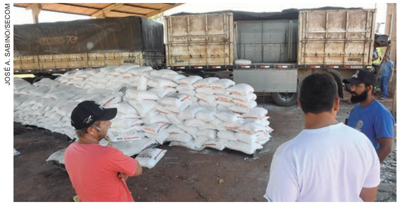
A distribuição vem sendo feita às terças e quintas, das 8h30 às 11h30 – a exceção é para os feirantes, que retiram o insumo às segundas, também de manhã

Pimentel lembrou que em breve haverá distribuição de mudas de uvas para a diversificação da fruticultura, além da produção própria de um