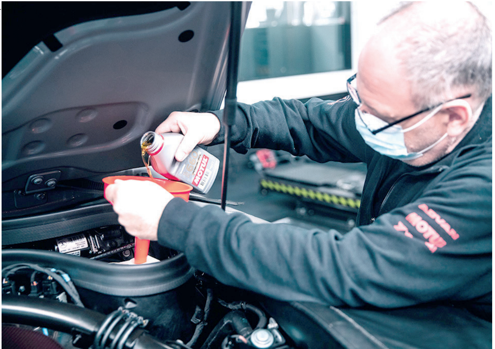
ENTRE os principais pontos de atenção após dias com o carro parado, estão a condição da bateria, calibragem dos pneus, nível do óleo e combustível, e a limpeza interna e externa do automóvel

Parado, o carro também tende a perder pressão e aderência nos pneus. Por isso, é indicado calibrá-los um pouco a mais antes da viagem para compensar essa perda. A despressurização natural pode afetar a sua forma arredondada, desencadeando uma trepidação ao volante até voltar ao formato correto novamente