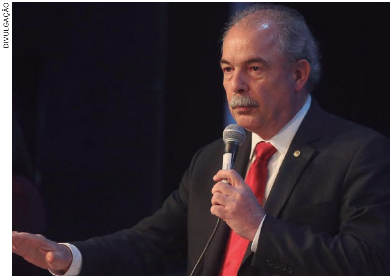
ENTRE os anunciados por Mercadante estão ex-ministros, empresários e integrantes do mercado financeiro

O futuro presidente da instituição também anunciou que o BNDES buscará fontes externas de recursos para compensar as restrições no Orçamento de 2023, como o Fundo Amazônia, que tinha R$ 1 bilhão parados e que será liberado. Mercadante anunciou que o banco tentará retomar uma parceria com a China para criar um fundo com o BNDES de US$ 10 bilhões e disse que a Europa tem 55 bilhões de