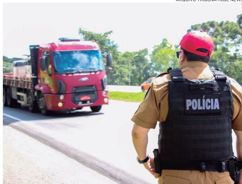
RODOVIAS do Noroeste, bem como as estradas do País terão reforço no policiamento durante o feriado de Natal

A 4ª Companhia de Polícia Rodoviária Estadual informou ontem que, em decorrência do Feriado de Natal e do grande fluxo de veículos esperado nas rodovias do Noroeste do Paraná, estará operando entre as 0h de hoje (23) até as 23h59min do dia 26 de dezembro com reforço de efetivo e viaturas em pontos estratégicos das rodovias sob sua circunscrição. A intenção é aumentar as ações de fiscalização, coibir o cometimento de infrações de trânsito e garantir a manutenção da segurança pública e viária à população.