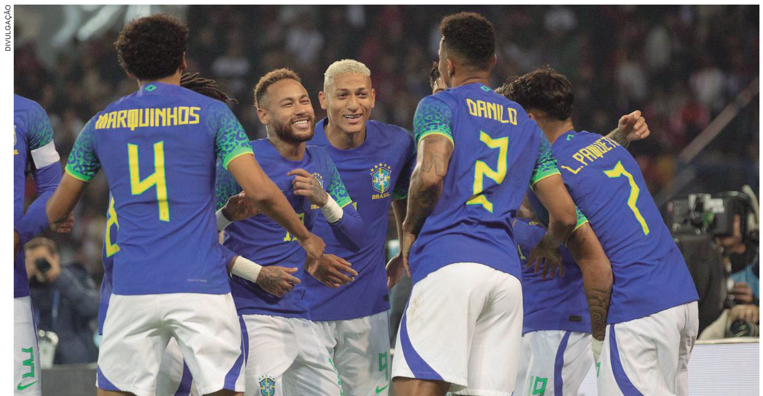
O primeiro lugar da lista foi devido ao total de pontos em vitórias após o tempo regulamentar. A Argentina venceu nos pênaltis, após o tempo regulamentar

Ao contrário de Argentina e França, que se aproximaram do líder Brasil, a Bélgica caiu duas posições: ocupa