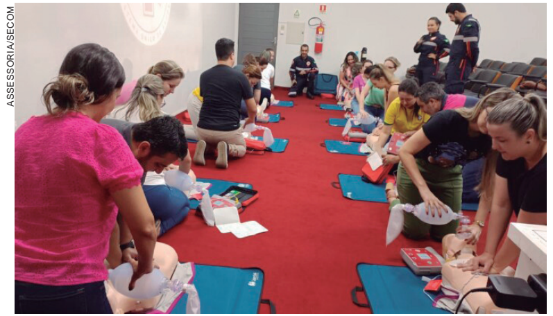
A capacitação é uma parceria com a Secretaria de Saúde e teve duração de três horas, com aulas teóricas e práticas