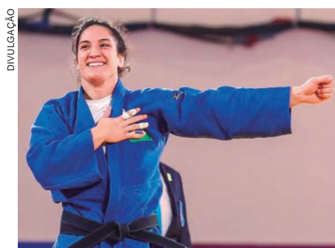
BRASIL encerra participação em Israel com 3 medalhas, uma delas ouro

Campeã mundial em outubro e medalhista olímpica nos Jogos de