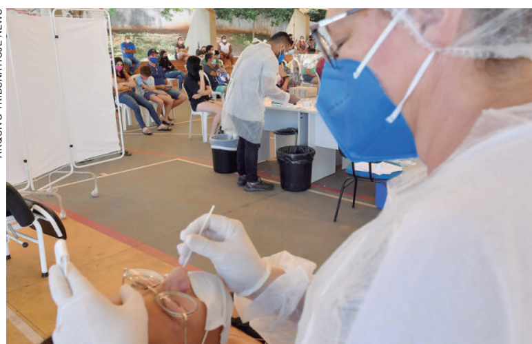
OS números de pessoas em isolamento domiciliar aumentaram e estavam ontem em 947, com 708 casos ativos e 239 considerados suspeitos

Existem hoje cinco pessoas de Umuarama internadas em