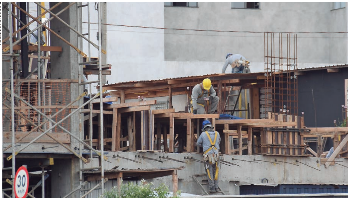
O maior volume de obras aprovadas engloba os edifícios residenciais, alguns de grande porte, salões, barracões comerciais e as residências de médio e alto padrão

O maior volume de obras aprovadas engloba os edifícios residenciais, sendo alguns de grande porte, os salões e barracões comerciais e as residências de médio e alto padrão,