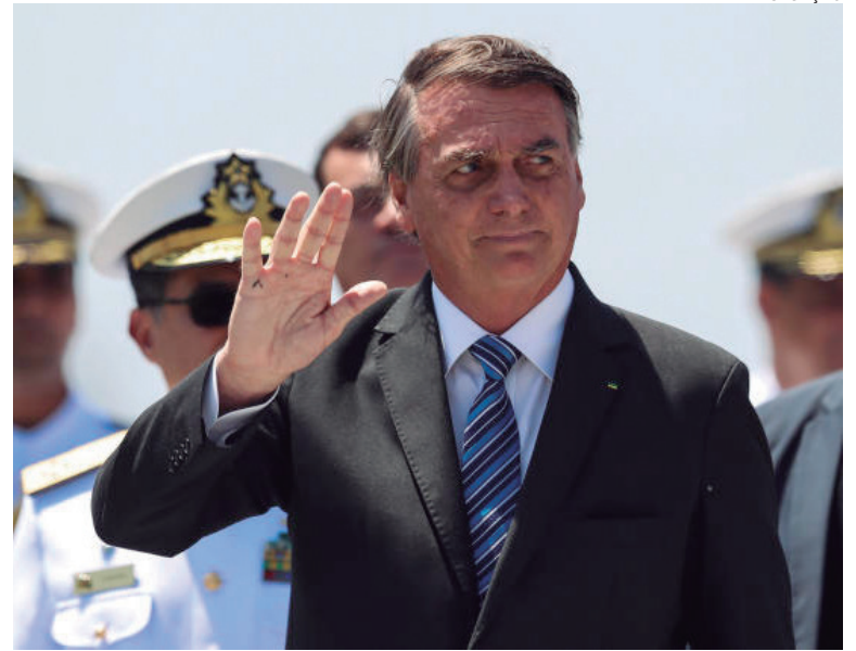
DECRETO beneficia militares das Forças Armadas e agentes do Sistema Único de Segurança Pública

A medida não será aplicada em casos estabelecidos por lei, relativos a crimes de tortura; lavagem ou ocultação de bens, direitos e valores; violência doméstica e familiar contra a mulher; organização criminosa; terrorismo;