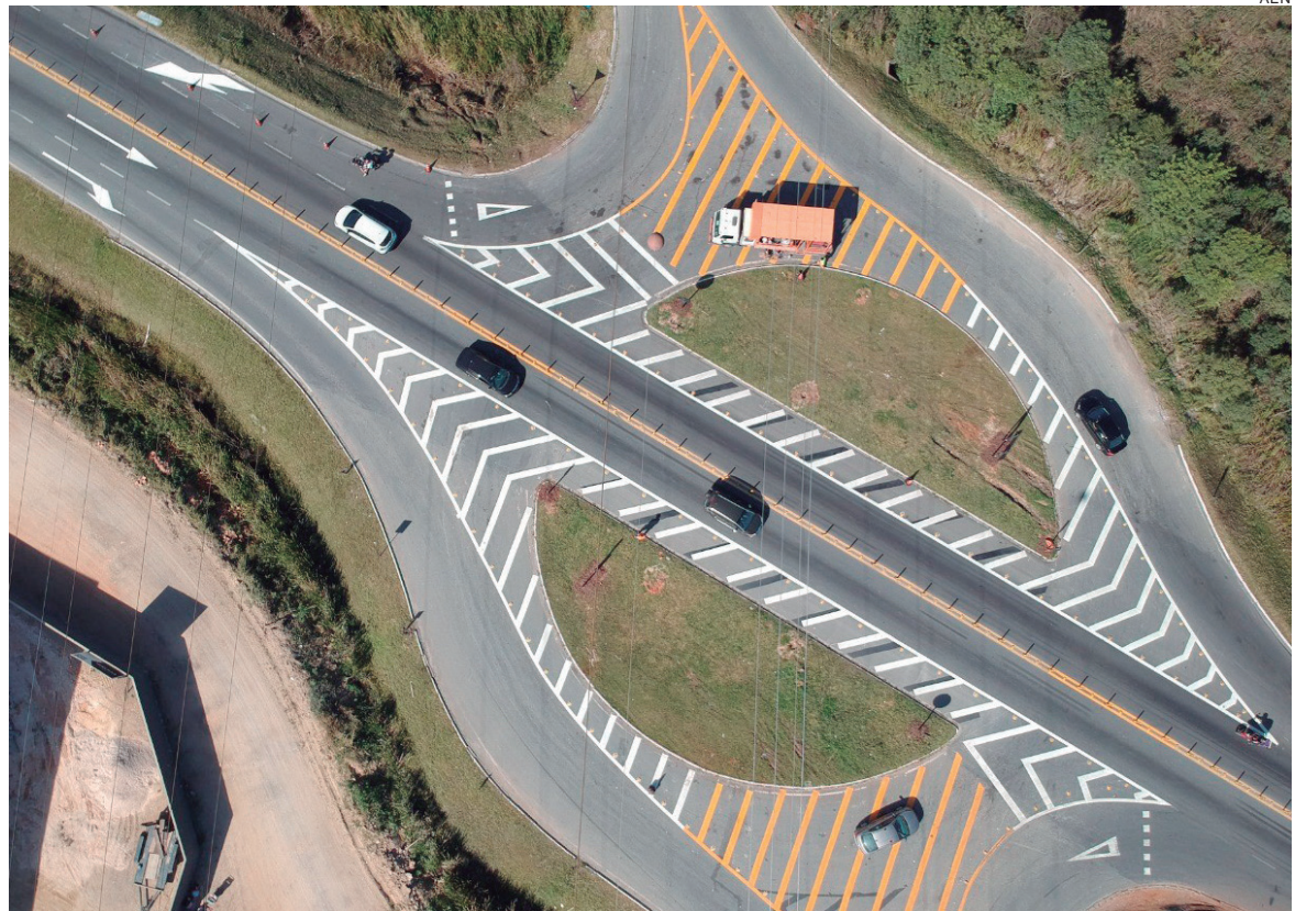
O Integra Paraná foi dividido em cinco regionais, contemplando uma malha de 964,52 kms de rodovias estaduais e federais

O COP contempla cerca de 6.000 quilômetros de rodovias estaduais, cujo pavimento não recebe um volume tão elevado de tráfego, e com menor número de veículos pesados. O valor investido em 2022