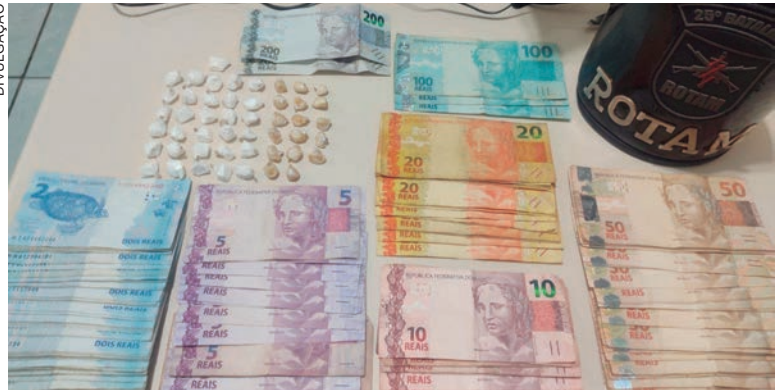
CRACK, cocaína e dinheiro, foram apreendidos na ação que aconteceu em um bar do município

A Polícia Militar cumpriu um mandado de busca e apreensão na cidade de Ivaté (47 quilômetros de Umuarama) e encontrou, além de drogas, também a quantia de R$ 2,3 mil. A ordem judicial determinava que a busca fosse realizada em um bar no centro do município. Por volta das 17h30 da última segunda-feira (27) na rua Maringá, os policiais deram início ao cumprimento da ordem.