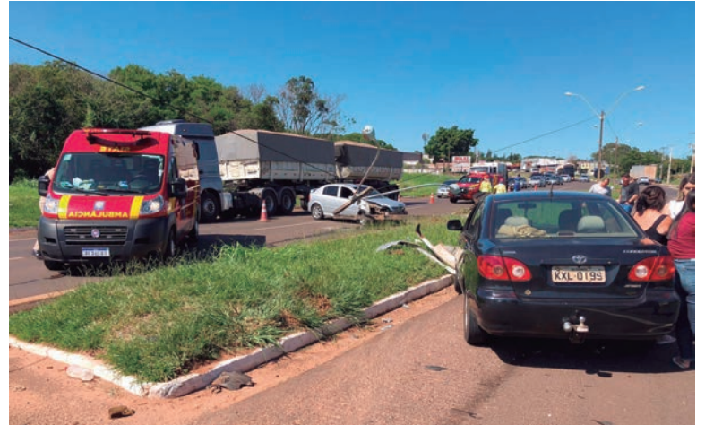
DEPOIS de colidir contra o Corolla, o Astra invadiu o canteiro central na PR-323 e arrancou um dos postes de iluminação

Equipes da Copel foram acionadas para averiguar os danos da colisão que também deixou vestígios de grande monta nos dois veículos envolvidos. Patrulheiros rodoviários de Cruzeiro do Oeste estiveram no local para analisar a cinemática da colisão.