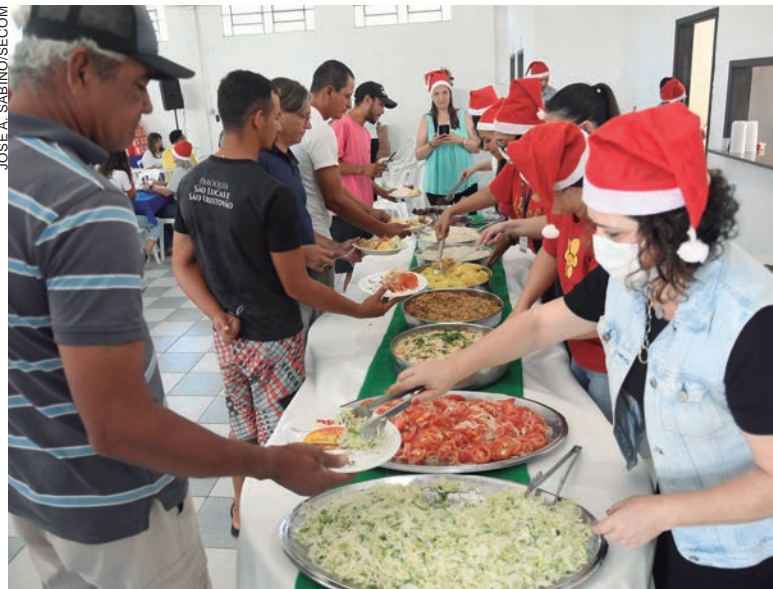
DEZENAS de pessoas em situação de rua, atendidas pelo Centro Pop e entidades parceiras, participaram do almoço no ARA

A Secretaria Municipal de Assistência Social reuniu dezenas de pessoas em situação de rua, atendidas pelo Centro Pop e entidades parceiras, para um almoço de confraternização, quando foi servido um delicioso churrasco num espaço cedido pela Associação de Recuperação dos Alcoólatras (ARA).