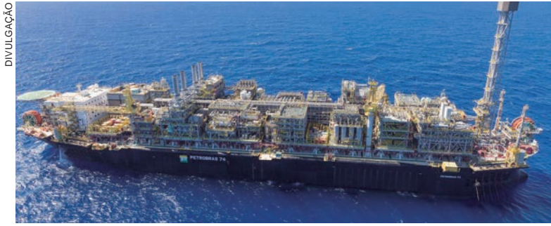
A produção de petróleo teve uma queda de 4,6% em relação ao mês anterior, mas se comparado a novembro de 2021, o volume significa um avanço de 8,5%

De acordo com a ANP, as paradas de produção em áreas do pré-sal motivaram os recuos no desempenho em novembro. "A queda na produção de petróleo e gás foi motivada, principalmente, por paradas de produção programadas e não programadas nos FPSOs Cidade de Ilha Bela, Cidade de Caraguatatuba e Cidade de Mangaratiba, localizados no Pré-Sal", informou.