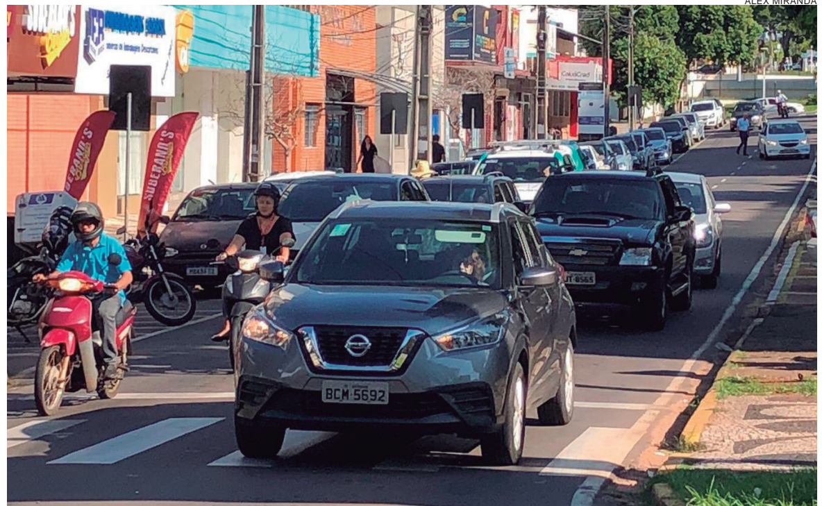
ARRECAÇÃO total somente em Umuarama em IPVA pode chegar a mais de R$ 71 milhões, não havendo inadimplência. O município fica com a metade

Nesse caso, o parcelamento deve ser pago por meio de Guia de Recolhimento (GR-PR), com a possibilidade de pagamento via PIX, já que a guia agora é emitida com um QR Code para este fim. O contribuinte pode pagar a GRPR em qualquer banco, inclusive nos digitais, não se restringindo aos conveniados com o Estado. O parcelamento pode