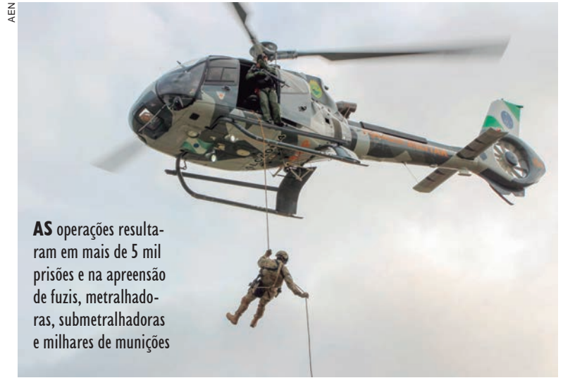
AS operações resultaram em mais de 5 mil prisões e na apreensão de fuzis, metralhadoras, submetaladoras e milhares de munições

Nas ações de trânsito, foram mais de 254 mil veículos vistoriados, sendo mais de 122