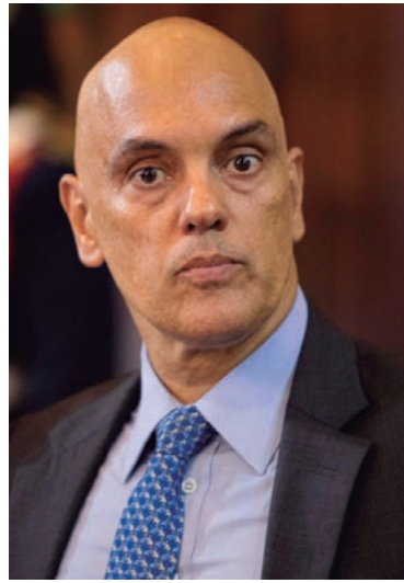
NO falso documento, consta que Moraes teria mandado se prender por "litigância de má-fé", isto é, por ter acionado o sistema judiciário sem causa plausível

"O Conselho Nacional de Justiça informa que a