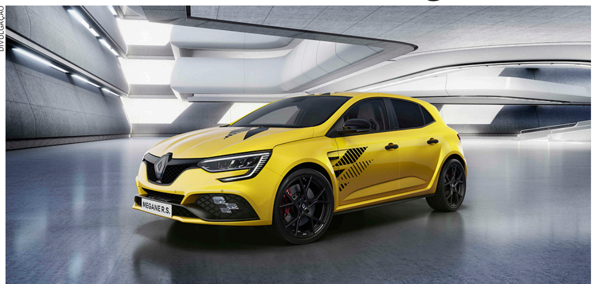
O Mégane R.S. Ultime exibe um design exclusivo, que remete aos padrões visuais da Renault Sport

A carroceria do Mégane R.S. Ultime exibe para-lamas mais