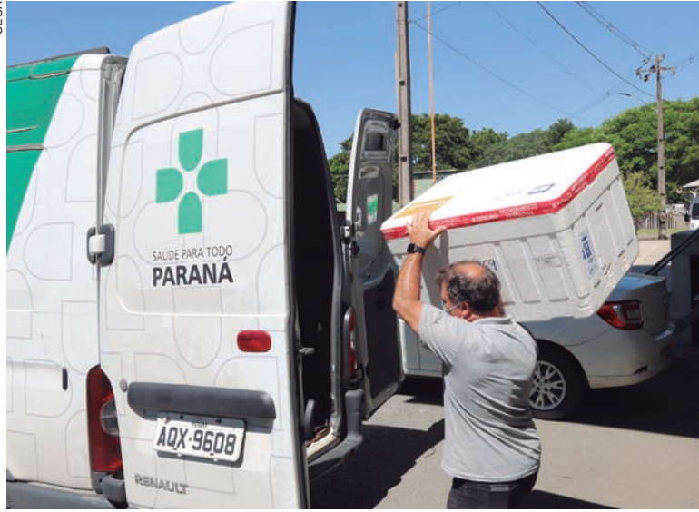
OS imunizantes foram solicitados pelos municípios e estão sendo retirados do Centro de Medicamentos do Paraná (Cemepar) pelas Regionais de Saúde

“Iniciamos a semana distribuindo mais doses aos municípios, enviadas pelo Ministério da Saúde, para a continuação da imunização no Paraná. Como desde o início da pandemia, assim que as vacinas chegam ao Estado, nossas equipes agilizam a separação e fazemos a logística o mais