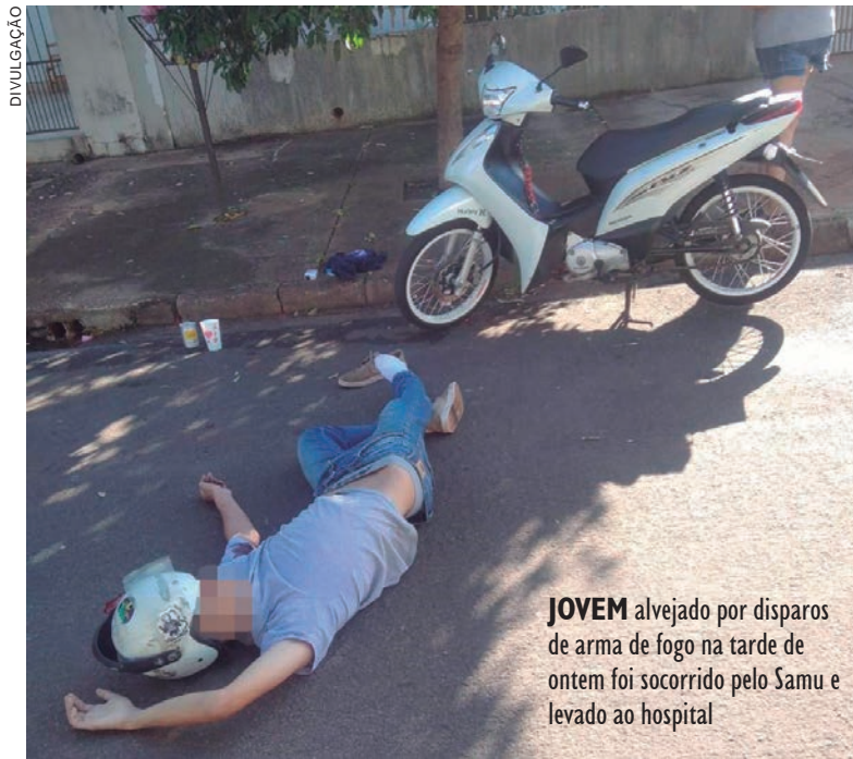
JOVEM alvejado por disparos de arma de fogo na tarde de ontem foi socorrido pelo Samu e levado ao hospital

Um jovem foi vítima de disparos de arma de fogo no final da tarde de ontem (segunda-feira, 16), quando trafegava com sua motoneta pela rua Edson Duarte Lopes, no Parque Danielle, em Umuarama. Equipes do Samu foram acionadas para prestar atendimento à vítima que, segundo testemunhas, teria sido alvejado com pelo menos dois tiros nas costas e outro em um dos braços. O jovem foi encaminhado ao hospital de plantão. Policiais militares compareceram no local para dar início às buscas pelos autores do atentado. Detalhes do caso foram apurados no decorrer da tarde e noite de ontem. A investigação será desenvolvida pela Polícia Civil, que pretende descobrir a motivação do crime.