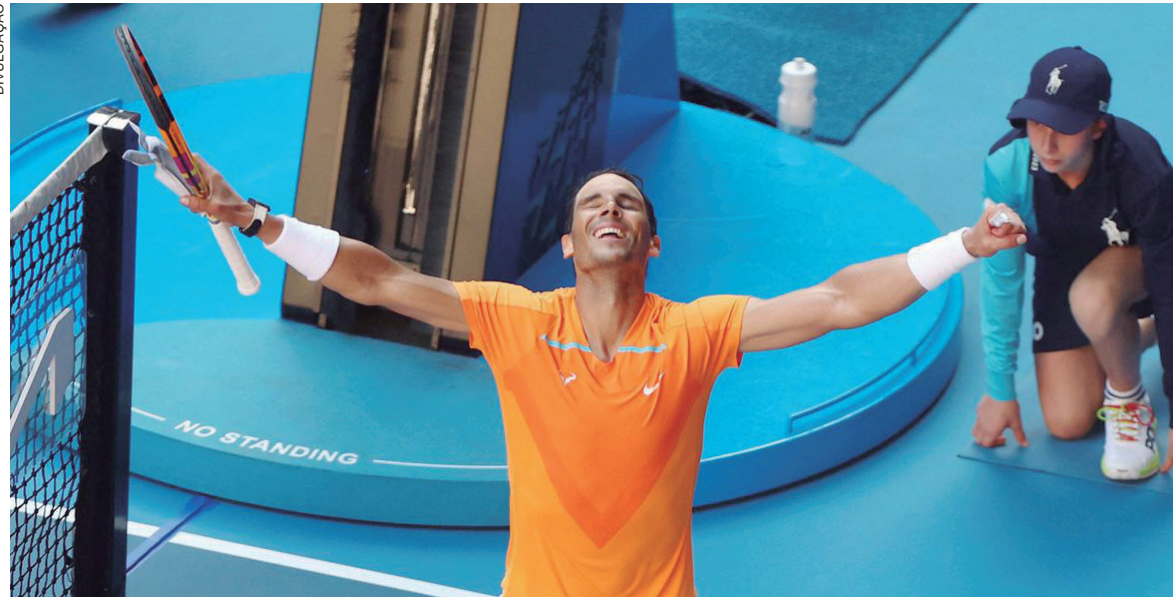
ESPAÑHOL superou britânico Draper, e australiano abriu mão por lesão

O atual campeão do Aberto da Austrália Rafael Nadal superou uma preparação difícil para avançar à segunda rodada com uma vitória em quatro sets sobre Jack Draper, ontem (segunda-feira, 16), depois que o tenista da casa Nick Kyrgios surpreendeu no primeiro dia ao desistir do torneio por causa de lesão.