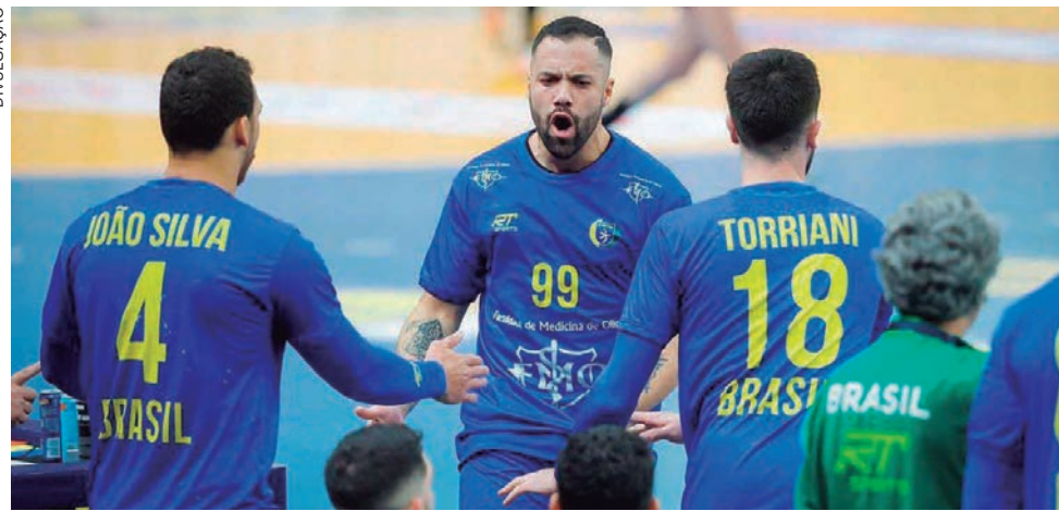
SELEÇÃO masculina volta à quadra às 14h de hoje contra a Hungria