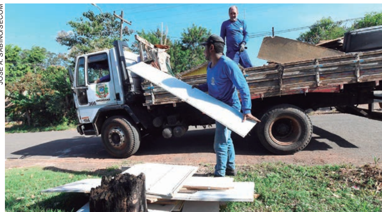
MORADORES do Vitória Régia, Alto da Boa Vista, San Remo II e Danielle devem separar materiais que possam acumular água e colocar na calçada em frente a suas casas

Outras localidades com alto risco de contaminação foram a região da Igreja São Paulo (Guarani/Anchieta) com 10%, o Parque Cidade Jardim com 6,8%, a região da Escola Malba Tahan com 6,5%, o Ouro Branco com 6,1%, a Zona 3 com 5,3%, a Zona 2 com 4,5%, os bairros Dom Pedro I e II com 4,4% e o Parque Castelo Branco com 4,1%.