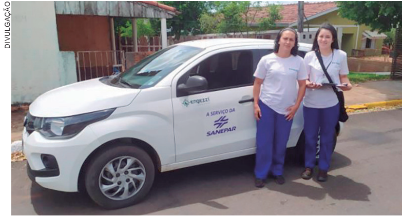
NOS encontros, os moradores serão orientados ainda para aguardar a liberação e a autorização da Sanepar para fazer a interligação dos imóveis à rede coletora

Também serão abordados temas referentes à instalação e o funcionamento adequado da