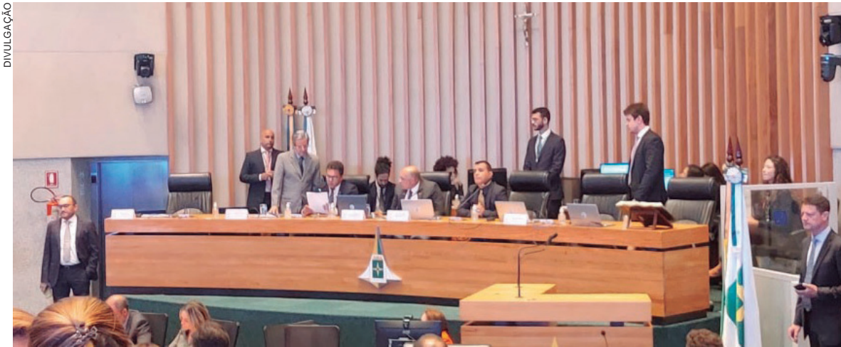
CADA bloco parlamentar terá até cinco dias para indicar os nomes indicados para compor o colegiado, formado por sete deputados distritais