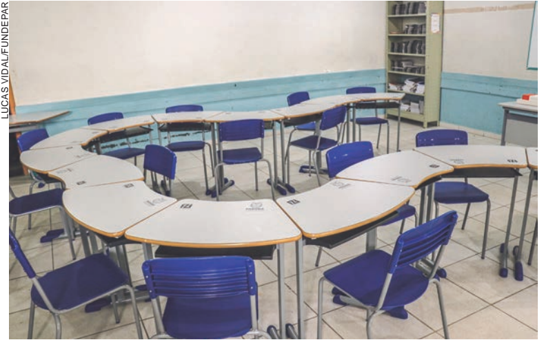
O novo modelo de mobiliário vai garantir mais interatividade, mais troca de conhecimento e colaboração entre os estudantes

diretor-presidente da Fundepar, também destaca que as novas organizações das salas de aula promoverão experiências mais colaborativas para os estudantes. “Esses conjuntos são extremamente inovadores, pois trazem uma nova dinâmica para os alunos e professores, além de tornar o ambiente em sala de aula ainda mais agradável para todos”, diz.