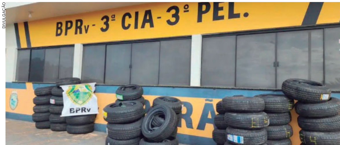
PARA entregar a mercadoria em Umuarama, os motoristas paraguaios disseram que receberiam R$ 200

Diante da suspeita de estarem carregando algum tipo de contrabando, as equipes policiais iniciaram buscas e encontraram inicialmente dois