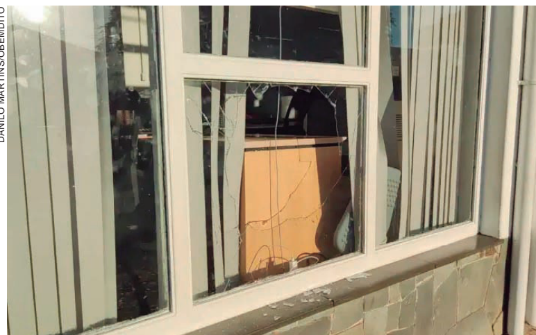
VIDRO de acesso ao escritório da agência bancária foi quebrado por bandidos, que aparentemente não tiveram êxito na invasão

A prisão aconteceu quando os seguranças, que não prestam serviço à referida agência, estavam patrulhando o centro comercial em motocicletas, quando escutaram o som de uma vidraça quebrando. Eles se aproximaram da agência e localizaram dois homens suspeitos correndo pelas imediações. Um deles, de 54 anos de idade,