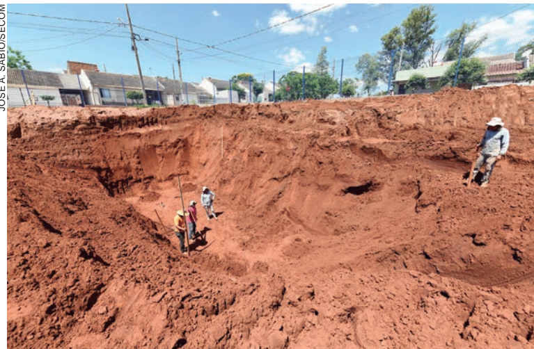
A construção da caixa foi iniciada no decorrer da semana no Conjunto Sonho Meu. Os resultados serão monitoradores para testar a sua eficiência

Pimentel citou como exemplo o baixadão da região central, compreendendo trechos