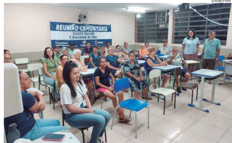
O curso será exclusivo para mulheres, que vão aprender de forma simples a identificar e consertar pequenos vazamentos

Os interessados devem procurar a Secretaria de Indústria e Comércio de Maria Helena, na Avenida Paraná, 1471, para fazer a sua inscrição. O curso será ministrado na Escola Municipal Nossa Senhora das Graças, com início às 9 horas.