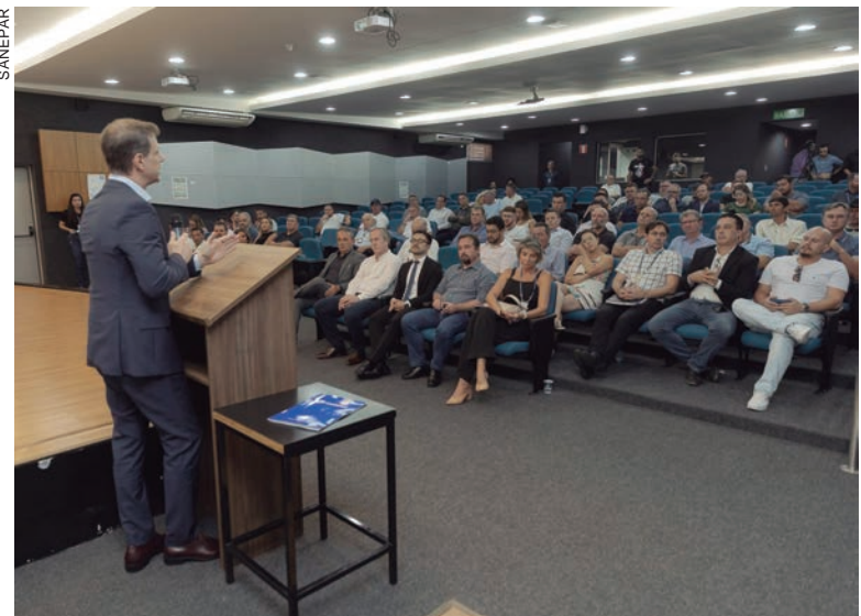
A estimativa de investimentos é em torno de R$ 1,2 bilhão durante todo o período da concessão