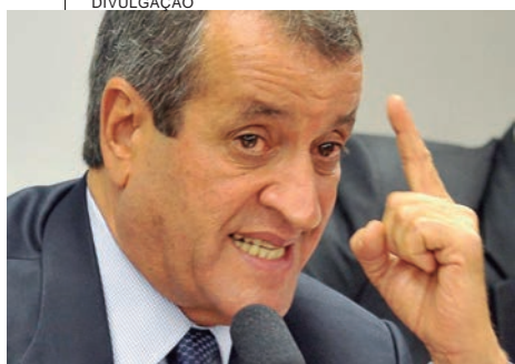
político. Tinha gente que colocava (o papel) no meu bolso, dizendo que era como tirar o Lula do governo. Advogados me mandavam como fazer utilizando o artigo 142, mas tudo fora da lei. Tive o cuidado de tritar”.

“Todos falaram na reunião, todos presentes, reunião de trabalho discutindo saídas comuns para o Brasil, e saí dessa reunião com documento histórico que é a carta de Brasília”, afirmou.