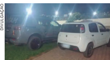
VEÍCULO tomado de assalto em Maringá seria entregue para uma pessoa desconhecida dos receptores em Umuarama

Eles receberam voz de prisão e foram encaminhados à Delegacia de Polícia.