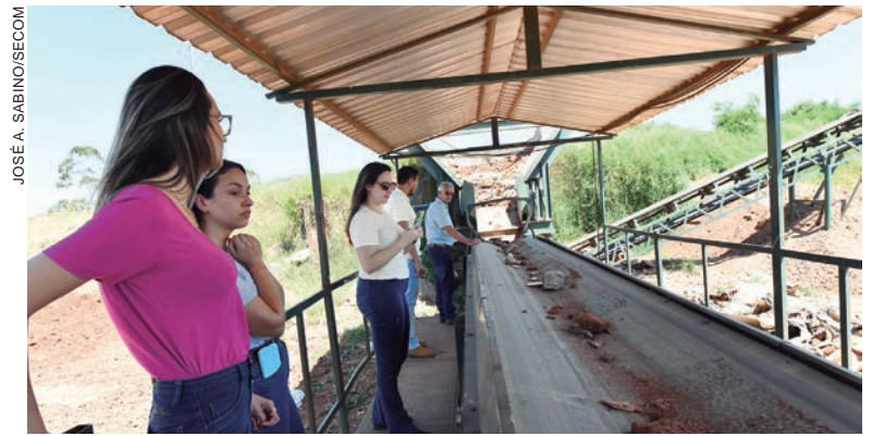
COM a usina, o município passou a oferecer às empresas do setor a opção de dar a destinação correta aos restos de obras

Para a implantação, em 2019, a usina recebeu o investimento de R$ 479 mil na aquisição dos equipamentos e R$ 30 mil em obras estruturais para instalação no Aterro Sanitário Municipal, em recursos próprios da Prefeitura.