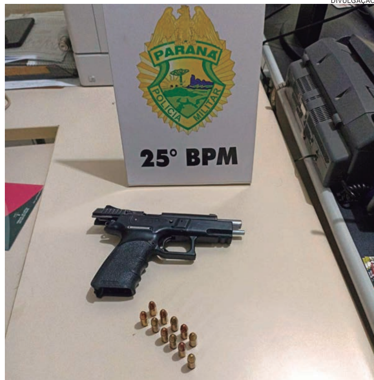
Arma apreendida pela Polícia Militar estava no interior do carro usado para sequestrar suposto olheiro de quadrilha assaltante

A dupla presa teria revelado aos policiais a suspeita de que a vítima, estaria envolvida com assaltantes que poderiam estar preparando ações naquela rodovia.