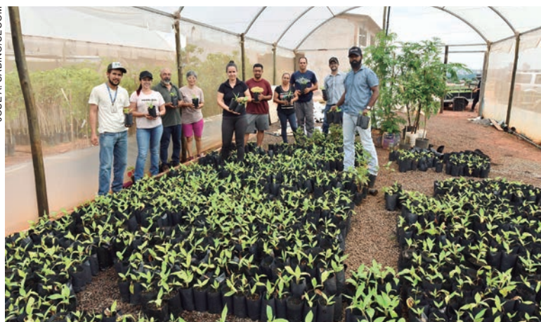
AS mudas foram adquiridas em Minas Gerais e desenvolvidas no viveiro municipal. Cada produtor recebeu de 300