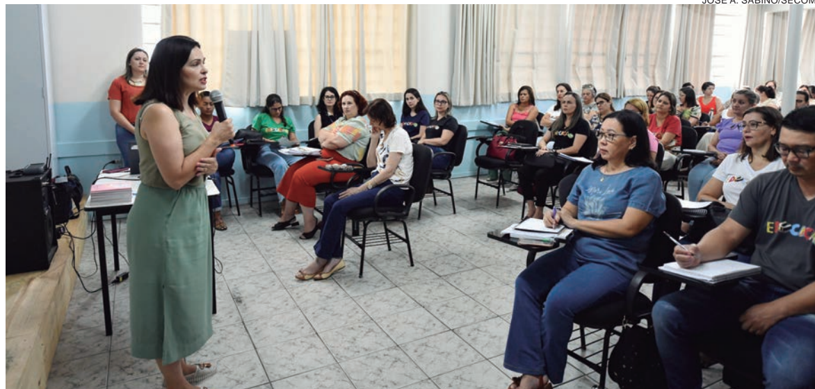
TREINAMENTOS ocorreram com a presença de mais de 120 diretores, secretários, equipe pedagógica e auxiliares administrativos