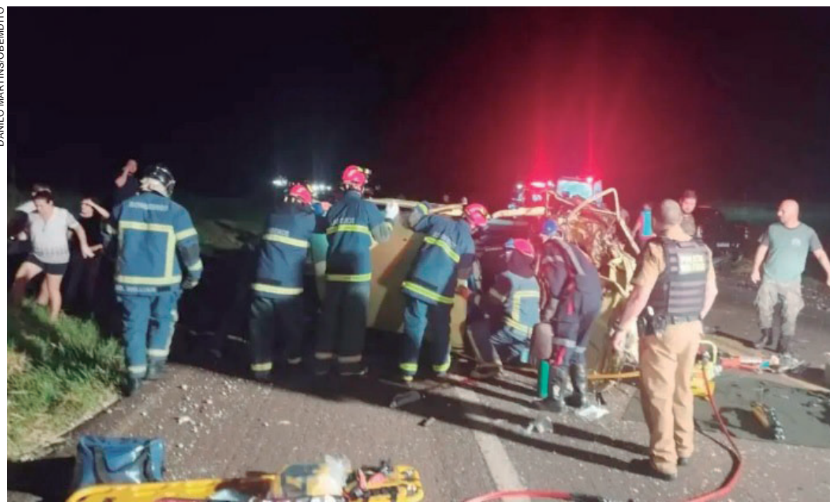
O motociclista teve partes do corpo amputadas e o condutor da Brasília não resistiu aos ferimentos grave se morreu no hospital

O clima era de grande comoção entre os pais que enviaram filhos ao retiro e se preparavam para uma noite festiva, onde entregariam cartinhas para serem repassadas às crianças.