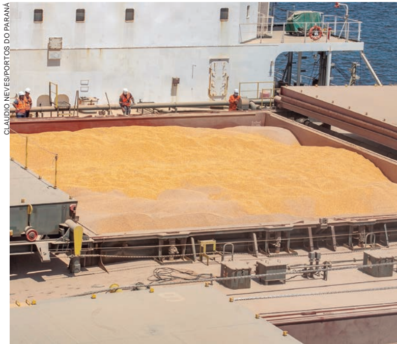
NO mês de janeiro, até o domingo (29), 19 navios atracaram no Porto de Paranaguá para carregar milho

No mês de janeiro, até este domingo (29), 19 navios atracaram no Porto de Paranaguá para carregar milho. Segundo o line-up desta segunda-feira (30), escala das embarcações para receber o granel, nove navios já estão em porto para carregar 587.324 toneladas e outros oito estão na sequência