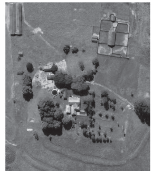
Foto da sede do imóvel.