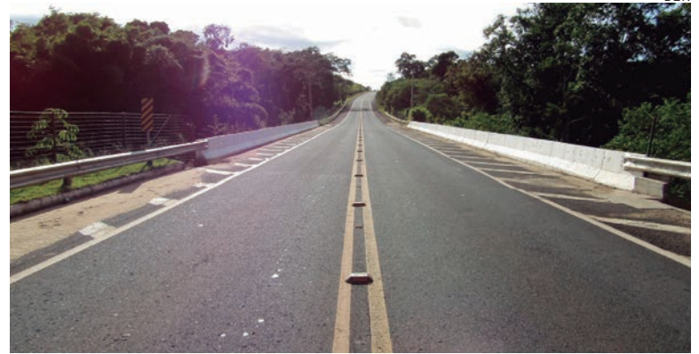
A ponte sofreu erosões na cabeceira e avarias no corpo do aterro, causado pelo excesso de chuvas ocorridos na região nos últimos meses

Estão previstos serviços de terraplanagem, pavimentação, recomposição de aterro, regularização de talude, assentamento, meios-fios, instalação de defensas metálicas, e nova sinalização, visando a