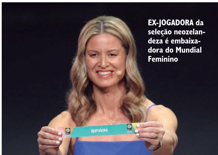
EX-JOGADORA da seleção neozelandesa é embaixadora do Mundial Feminino

saudita] for concretizado, isso afetará a forma como as pessoas veem o esporte. É difícil quando estamos nos esforçando tanto para levar as coisas adiante”.