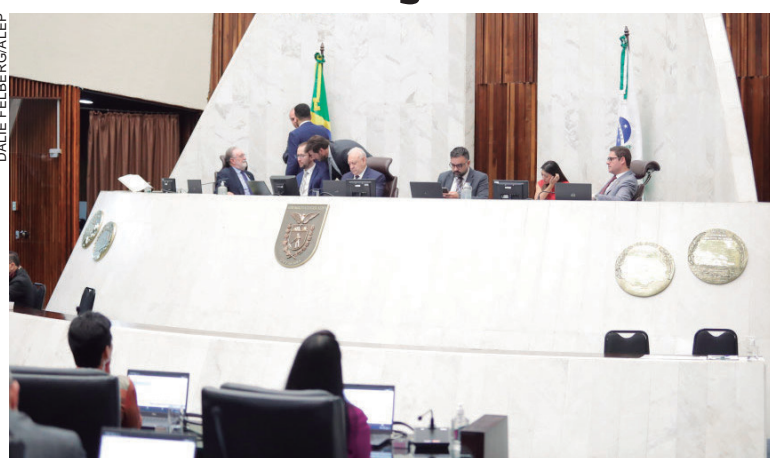
PROPOSTA veda a utilização de fogueiras e o uso indiscriminado do fogo e materiais inflamáveis nas Unidades de Conservação de Proteção Integral do Estado

A proposta também proíbe o uso de troncos, tocos, galhos, folhas ou outros materiais orgânicos retirados das Unidades de Conservação, ainda que mortos, para produzir fogo, salvo as exceções determinadas no projeto. O descumprimento da Lei sujeita