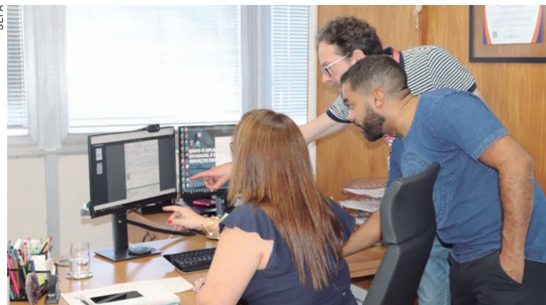
EM breve será possível acompanhar toda a movimentação financeira em tempo real, possibilitando maior controle dos gastos públicos por parte da população

Atualmente o SIAF disponibiliza as informações da gestão financeira do Estado, mas não em tempo real, e o SIAFIC vai melhorar a disposição dessas informações. Em breve será possível acompanhar toda a movimentação financeira em tempo real, como atualização de demonstrativos fiscais (receita e despesa), execução de qualquer tipo de convênios e contratos, além da aplicação