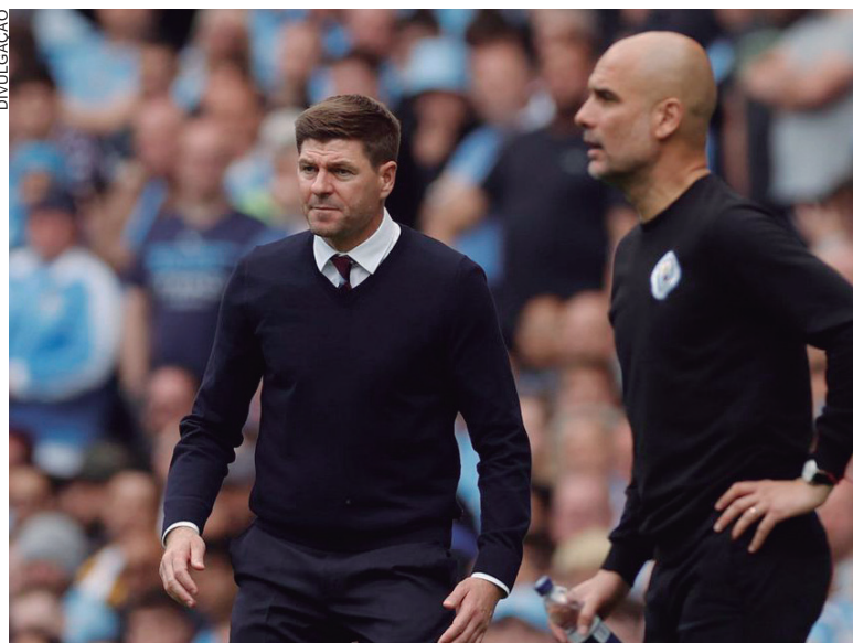
AO defender o Manchester City, técnico afrontou o ex-capitão do Reds

defender meu clube, mas não representei bem meu clube colocando o nome dele nesses comentários estúpidos”, acrescentou. “Peço desculpas e disse a ele pessoalmente, mas tenho que fazer isso aqui também. Sinto muito por ele, por Alex, sua esposa, filhos e família porque foi estúpido”, completou.