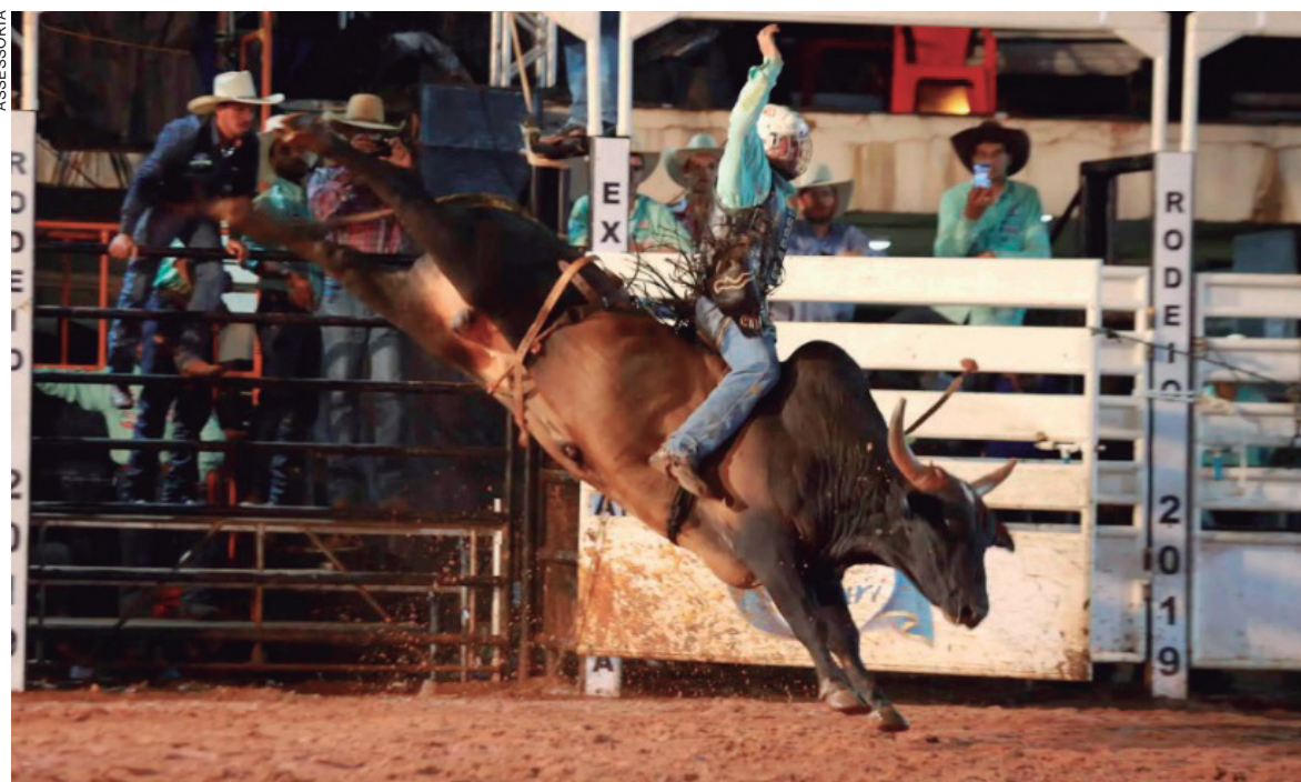
ESTE ano o rodeio em touros volta a dividir a arena com as montarias em cavalos

O rodeio em cavalos volta à programação da Expo Umuarama depois de 15 anos de ausência. Será uma emoção a mais para quem gosta de ver o bicho pegar e a arena tremer. A Sociedade Rural caprichou na seleção das boiadas e tropas. O que há de melhor no Paraná estará em solo umuaramense, segundo o coordenador da