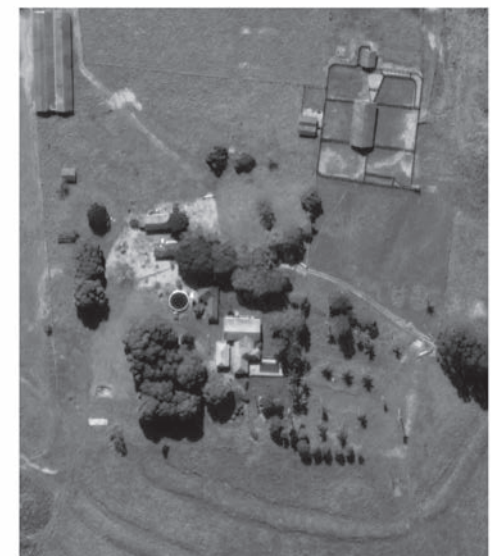
Foto da sede do imóvel.