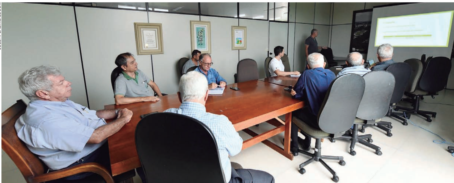
O valor médio da terra nua em Umuarama subiu de R$ 27.248 para R$ 28.825 por hectare, para efeitos de cálculo do ITR

Com isso, o valor médio da terra nua em Umuarama subiu de R$ 27.248 para R$ 28.825 por hectare, para efeitos de cálculo do ITR. Já o valor de mercado, conforme a Secretaria de Estado da Agricultura e do Abastecimento (Seab), por hectare, é de R$ 45 mil em média. A diferença se justifica pelo desconto de benfeitorias que não são consideradas no cálculo de preço com base no VTN, que considera apenas a terra.