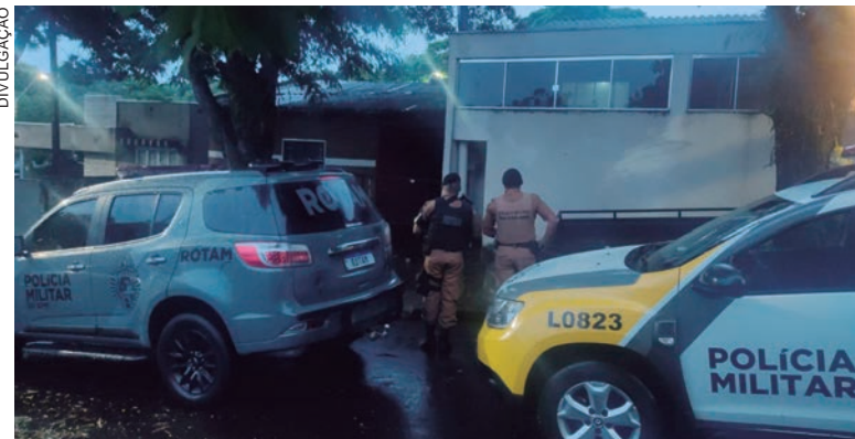
POLICIAIS civis e militares cumpriram mandados de busca e apreensão em residências de Umuarama e de Douradina

se esse casal possui envolvimento com os fatos ou apenas adquiriram o aparelho celular sem conhecimento. O outro