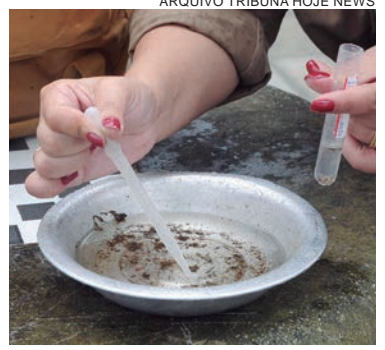
NO boletim divulgado ontem, cinco regiões atendidas por unidades básicas de saúde seguem em situação de alerta

Jardim Panorama (7 cada). Entre as regionais de saúde do Noroeste do Estado, Paranavaí lidera com 523 casos positivos, seguida pela região de Umuarama (392), Cianorte (73) e Campo Mourão (37), enquanto Maringá soma 592 casos confirmados. Em todo o Paraná, conforme o último boletim da Secretaria de Saúde, já foram confirmados 3.638 casos e cinco mortes.