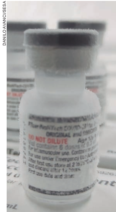
A vacina bivalente é uma versão atualizada para a proteção contra cepas do coronavírus, incluindo a variante Ômicron

enviados para os 399 municípios do Paraná na próxima quinta-feira (23), perto do início da campanha.