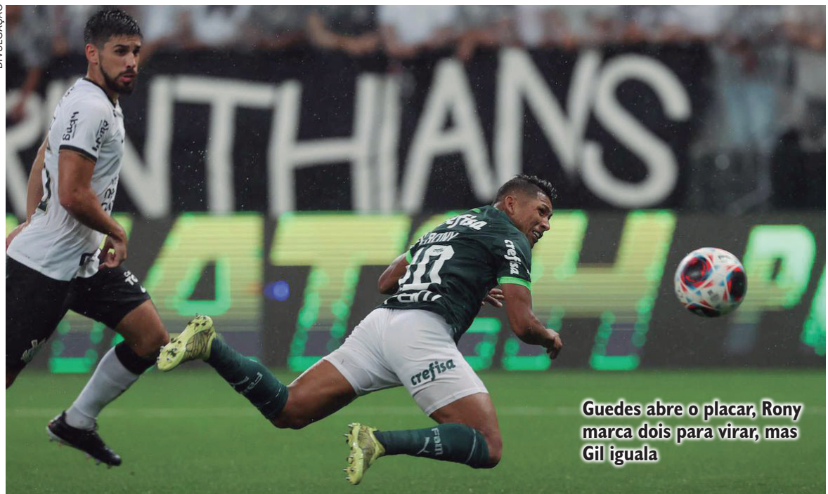
Guedes abre o placar, Rony marca dois para virar, mas Gil iguala

Com a vantagem no placar o Palmeiras passou a adotar uma postura mais conservadora, recuando suas linhas e dando campo para o Corinthians jogar. E a falta de ousadia do Timão foi punida aos 32 minutos, quando Giuliano levantou a bola na área para Gil bater de primeira para dar números finais ao confronto.