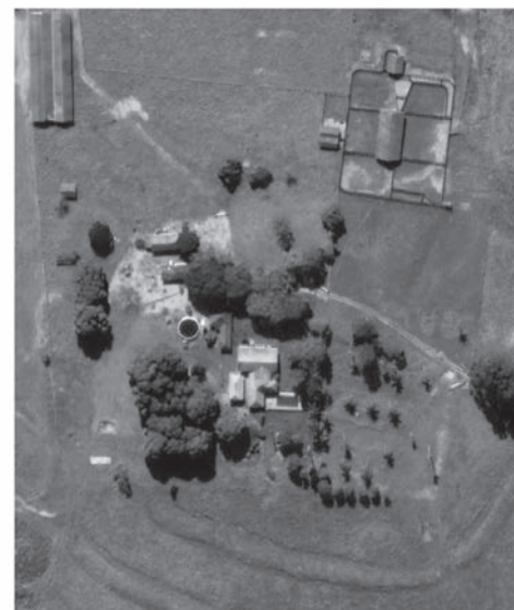
Foto da sede do imóvel.