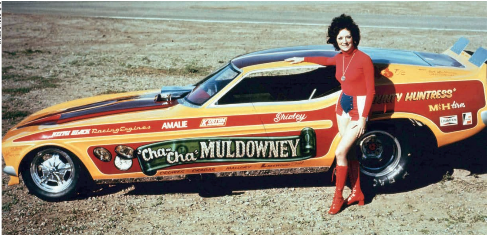
SHIRLEY Muldowney se destacou nas pistas, com títulos e recordes e hoje figura na lista dos 50 melhores pilotos dos EUA de todos os tempos