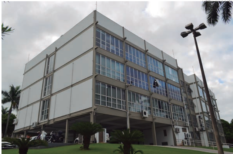
EM fevereiro, o município recebeu do Governo do Estado, R$ 1.060.535,46. A maior parte foi referente à arrecadação do IPVA (R$ 796.558,12).

De tudo o que foi repassado a todos os municípios em fevereiro, R$ 554,8 milhões são referentes ao Imposto Sobre Operações Relativas à Circulação