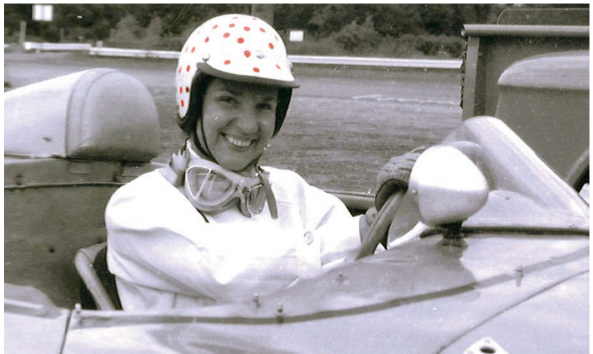
DENISE McCluggage foi uma das fundadoras do jornal - e hoje, site — AutoWeek e como piloto foi campeã das 12 Horas de Sebring em 1961 e do Rali de Monte Carlo em 1964

mundo a conquistar o título duas vezes. E como se não bastasse, em 1982, a piloto levou o troféu pela terceira vez. Suas vitórias a fizeram ficar na quinta posição entre os 50 melhores pilotos da lista oficial da federação dos Estados Unidos, e hoje ela é considerada uma lenda das pistas.