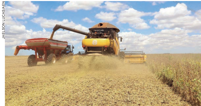
O avanço da colheita da safra brasileira, combinado com os preços internacionais e o dólar desfavorável ao produtor, reflete no valor pago ao sojicultor

O boletim analisa ainda a relação de preço entre milho