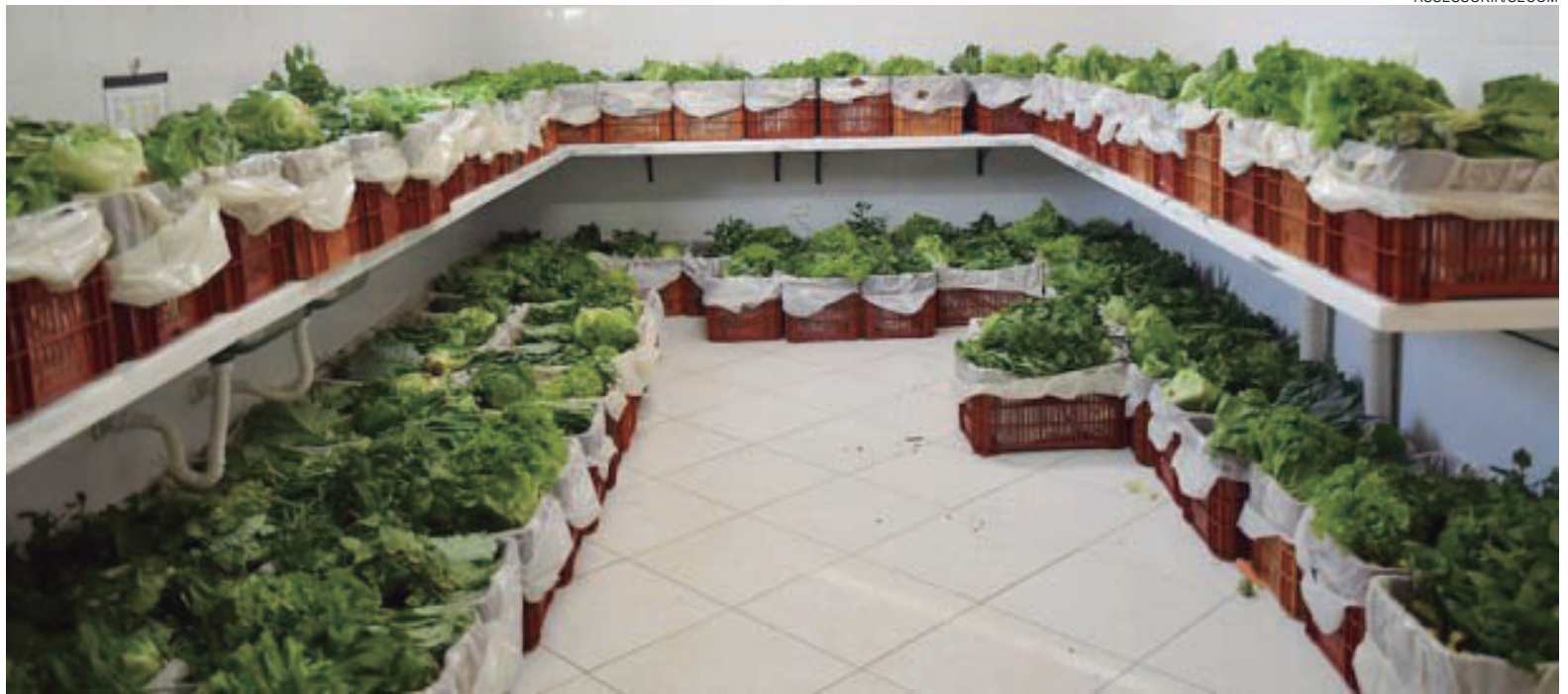
ALÉM de estimular o desenvolvimento, programa garante o abastecimento de instituições da rede socioassistencial, de segurança alimentar e nutricional

“É mais uma chance para os investidores, industriais e