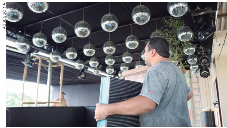
ESPAÇOS estão prontos, depois de seis meses de preparativos para o lançamento da Expo Umuarama 2023

Ainda segundo Gaiari, todos os espaços comerciais do evento foram locados a dois meses da abertura. Mesmo com uma área de 240 mil metros quadrados (10 alqueires), o parque de exposições da cidade ficou pequeno diante do interesse de tantas marcas e empresas. “Isso mostra a credibilidade da Expo Umuarama, que segue em alta a cada nova edição”.