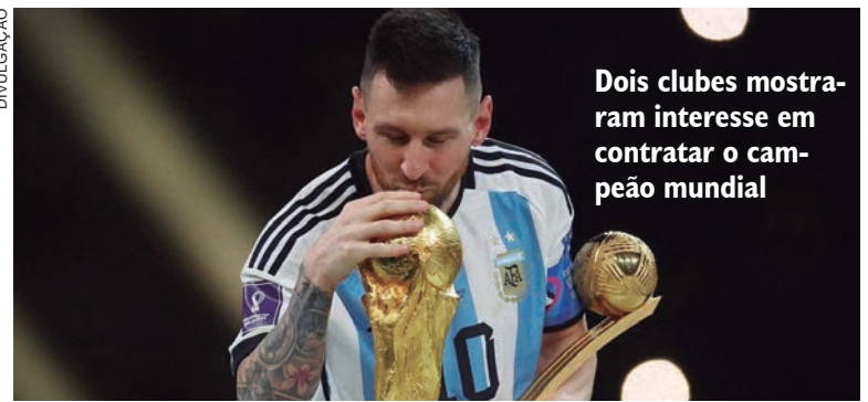
Dois clubes mostraram interesse em contratar o campeão mundial

A nação rica em petróleo nomeou Messi seu embaixador do turismo no ano passado, e ele visitou Jeddah em maio, antes de retornar em janeiro para um amistoso do PSG contra um time de estrelas da Liga Saudita, quando enfrentou o grande rival Cristiano Ronaldo.