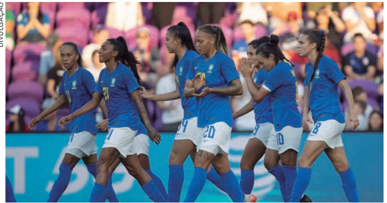
OS confrontos com duas seleções top 5 do ranking da Fifa encerrarão a fase preparatória da seleção brasileira para a Copa do Mundo

A seleção brasileira, comandada pela técnica Pia Sundhage, estreará na fase de grupos da Copa do Mundo contra o Panamá, no dia 24 de julho, em Adelaide (Austrália). Na sequência, o país enfrenta a França, no dia 29, em Brisbane