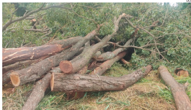
FISCAIS do IAT constataram a supressão de 60 árvores de Ipê Roxo. Como não havia autorização para o corte, a madeira foi retida, a área embargada e o proprietário multado

O Instituto Água e Terra (IAT), vinculado à Secretaria de Estado do Desenvolvimento Sustentável (Sedest), impediu que uma ação de desmatamento ilegal em Tapira (cidade localizada a 66 quilômetros de Umuarama), alcançasse proporções ainda maiores. Durante uma ronda, fiscais do órgão ambiental localizaram um terreno na zona rural da cidade e constataram a supressão de aproximadamente 60 árvores de ipê roxo. Como não havia autorização para o corte, a madeira foi retida, a área embargada e o proprietário multado