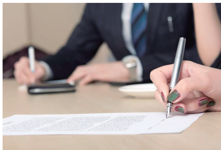
EM 2018, mulheres recebiam em média 79,5% do salário dos homens

O texto do governo determina que empresas com mais de 20 empregados publiquem relatórios de transparência salarial, para permitir a comparação objetiva dos salários e remunerações de homens e mulheres.