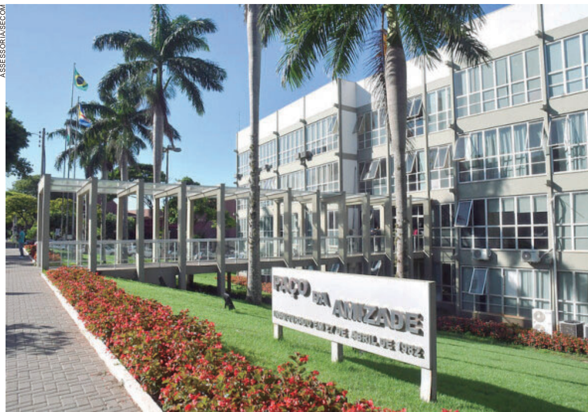
OPORTUNIDADES de negócios vão até dia 31 e estão abertas para empreendedores de todos os portes

Na sexta-feira, dia 24, também haverá uma tomada de preços – para contratação de empresa que realize o serviço de pintura e limpeza para conclusão do Centro de Eventos – e um pregão