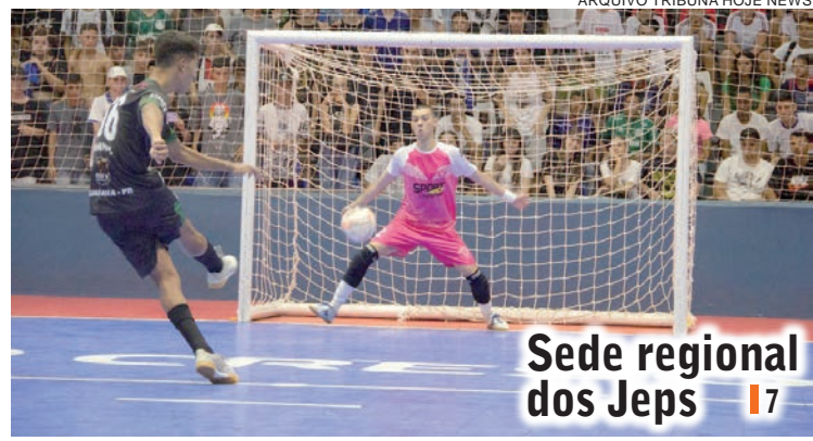
Sede regional dos Jeps | 7