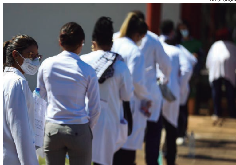
PROGRAMA abre 15 mil novas vagas e inclui outras áreas de saúde

Palácio do Planalto, a ministra da Saúde, Nísia Teixeira, destacou que o governo está empenhado em fortalecer o programa, classificado por ela como essencial para o Sistema Único de Saúde (SUS) e para a sociedade brasileira.