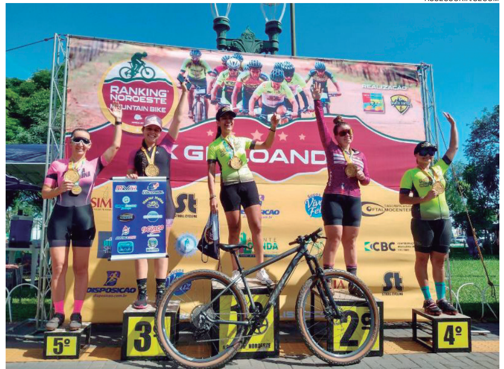
O trajeto de terreno misto mesclou curvas acentuadas com subidas, calor e um nível técnico bem elevado

O dirigente também agradeceu aos patrocinadores Orthodontic, Master Motos, Uvel, América Bike Shop, Clínica Santa Cecilia, Jean Representações, Extratus Farma, Baterax, rede de postos Colonial, BK Celulares, MTB Club Umuarama, RVR Rodas, Umurroll,