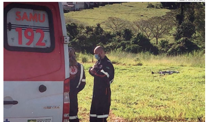
CORPO do jovem encontrado logo pela manhã com sinais de esfaqueamento no pescoço, costas e em uma das mãos

De acordo com a polícia, por ser um bairro novo, com poucos moradores e pequena iluminação, o ponto (fundos da comunidade) geralmente é frequentado por usuários de