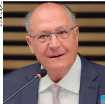
VICE-PRESIDENTE Geraldo Alckmin também criticou a taxa Selic

“Não há nada que justifique ter 8% de taxa de juros real, acima da inflação, quando não há demanda explodindo e, de outro lado, no mundo inteiro, há praticamente juros negativos.