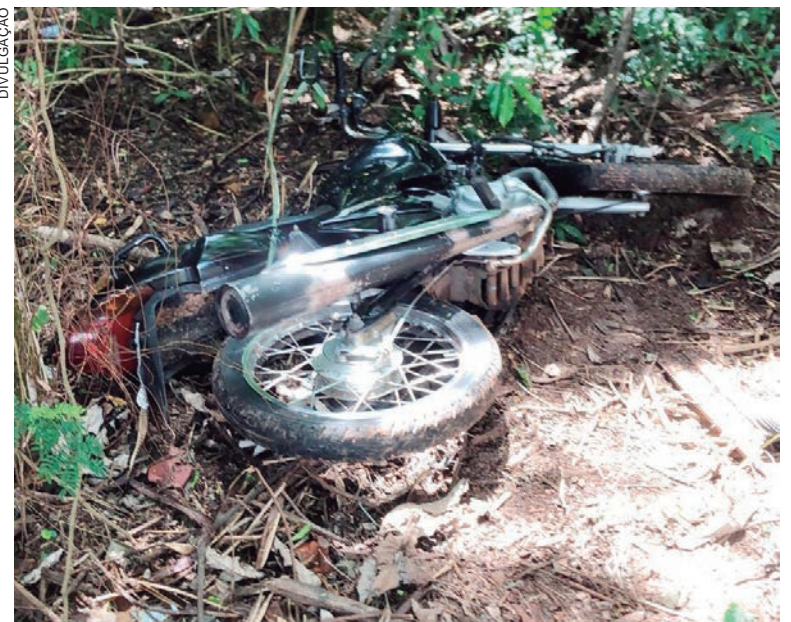
MOTOCICLETA foi encontrada jogada em uma mata, nos fundos do Jardim Panorama

A Polícia Militar de Umuarama recuperou no início da tarde de ontem, uma motocicleta que tinha havia sido furtada na cidade. A recuperação ocorreu no bairro Jardim Panorama. A princípio a moto estaria com o rapaz que foi encontrado morto naquela manhã.