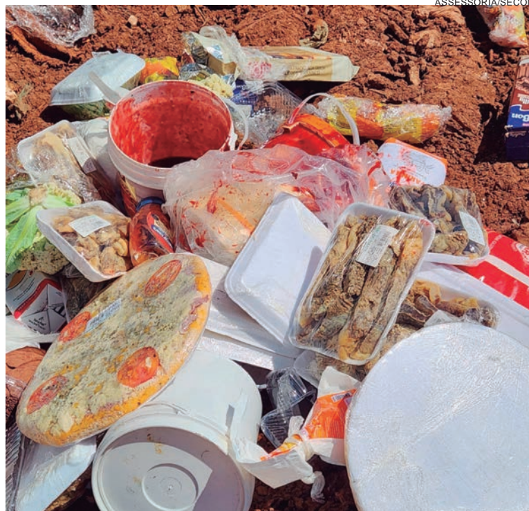
TODOS os itens foram apreendidos e o proprietário do comércio foi multado. Os alimentos foram descartados no aterro sanitário municipal

O consumo de alimentos vencidos pode causar diversos problemas à saúde. Os sintomas mais comuns são dores estomacais, diarreia, infecção alimentar, vômitos e náuseas. Pessoas acometidas por doenças crônicas, como diabéticos,