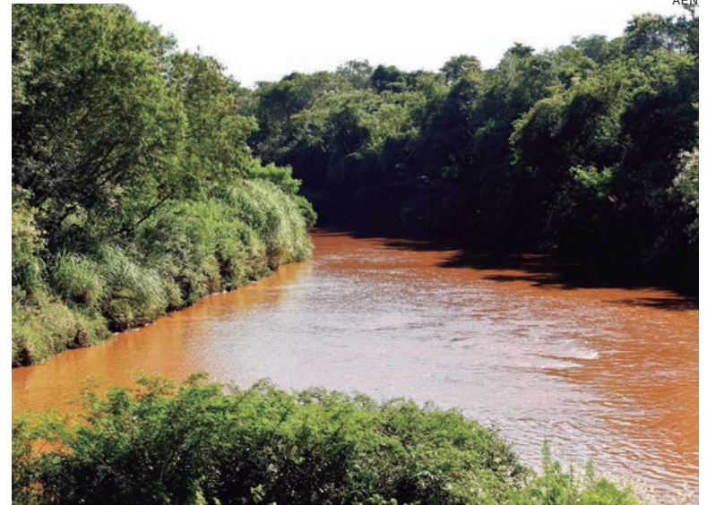
REGIÃO Noroeste vai debater políticas públicas referentes ao uso dos recursos hídricos e erosão nas cidades que formam as Bacias do Rio Pirapó/Parapanema

A pauta principal é a atualização do regimento interno que está sendo realizada pela Câmara de Técnica dos Instrumentos de Gestão do comitê. Haverá ainda uma apresentação do Instituto Água e Terra (IAT) sobre as causas e os trabalhos mitigatórios