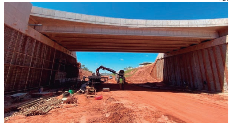
O tráfego será interditado nas marginais e direcionado para a pista principal, onde está o novo viaduto, que terá liberação para o tráfego de veículos

As obras de duplicação da PR-323 atingiram 80% de execução e devem ser entregues em maio. Os viadutos estão praticamente concluídos,