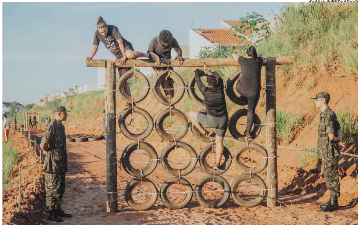
AS equipes enfrentaram desafios únicos e mostraram que são verdadeiros guerreiros, pois não desistiram em nenhum momento e todos alcançaram a linha de chegada

A Prefeitura de Umuarama realiza, com apoio do Conselho Municipal dos Direitos do Idoso, o primeiro concurso Miss e Mister Serviço de Convivência Para Idosos de Umuarama. De 54 candidatas, 20 foram classificadas para a final, que acontece no dia 28 de abril, às 19h30 no Teatro do Centro Cultural Vera Schubert. Já os sete candidatos ao título de Mister fizeram a prova de traje de gala na manhã de ontem (27). O evento é coordenado pelo Serviço de Convivência e Fortalecimento de Vínculos dos Idosos (SCFVI), da Secretaria de Assistência Social. A fase eliminatória, realizada no anfiteatro do Ceju (Centro da Juventude), contou com a presença voluntária de quatro jurados.