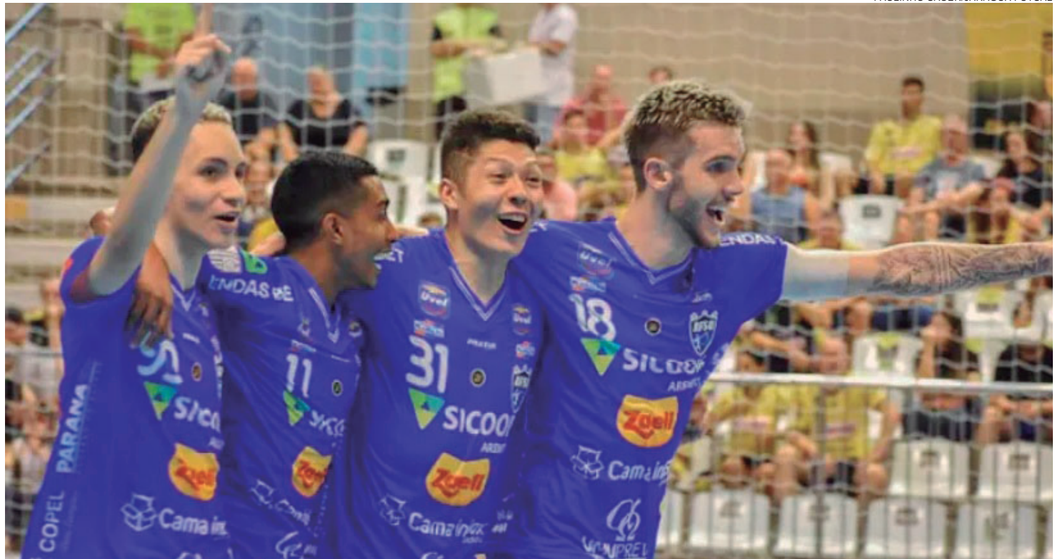
O próximo desafio do Umuarama pela Liga será em 1º de abril, contra a equipe do Praia Clube, na Arena Praia, cidade de Uberlândia/MG

Pelo Campeonato Paranaense de Futsal – Chave Ouro, o time da Capital da Amizade entra em quadra