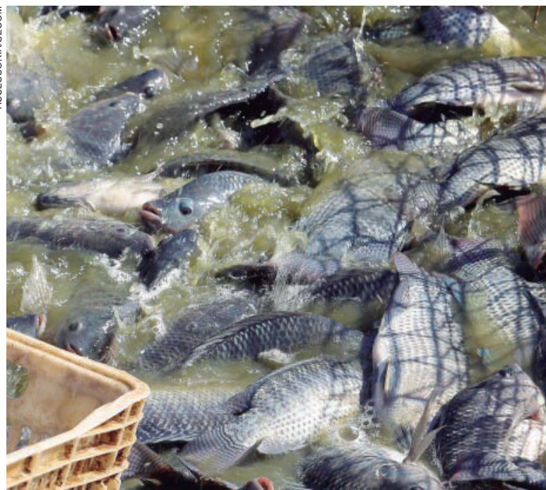
A ideia do encontro é mostrar aos proprietários rurais as pesquisas avançadas e amplo conhecimento técnico do IDR para o desenvolvimento da piscicultura

De acordo com o Anuário PeixeBR, uma publicação de referência do setor que trabalha com outros dados e metodologia, o Paraná manteve o protagonismo nacional na piscicultura também em 2022, com a produção de 194 mil toneladas, à frente de São Paulo, Minas Gerais, Rondônia e Santa Catarina. O Brasil alcançou 860 mil toneladas nesse indicador. De 2021 para 2022 a evolução na Região Sul foi de 2,4%. No mundo, foram produzidas 6,5 milhões de toneladas do pescado no ano passado.