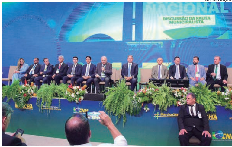
REIVINDICAÇÕES de prefeitos serão entregues aos Três Poderes

O documento encaminhado pela CNM apresenta quatro propostas de emenda à Constituição. “Uma para estender aos municípios os benefícios da Reforma Previdenciária, que priorizou apenas as contas da União; outra para viabilizar a coincidência das eleições; também