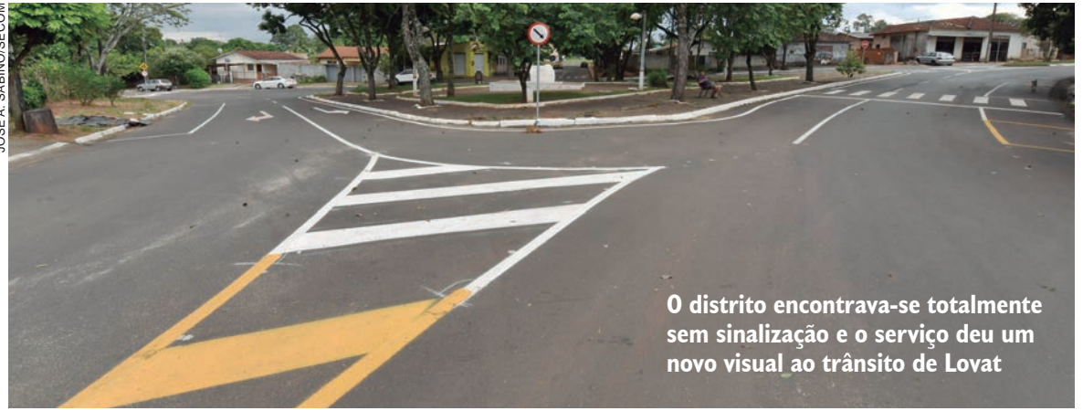
O distrito encontrava-se totalmente sem sinalização e o serviço deu um novo visual ao trânsito de Lovat

e hortaliças e também recebe um fluxo diário de ciclistas, que percorrem estradas rurais da região em atividades físicas e fazem parada na praça central para um descanso. Foram aplicados cerca de 1 mil m 2 de pintura, aproximadamente 30 aproximações de cruzamentos com a legenda 'Pare' e na sinalização vertical foram colocadas 30 placas fixadas em tubos de aço. Outras 20 placas foram reposicionadas e substituídas.