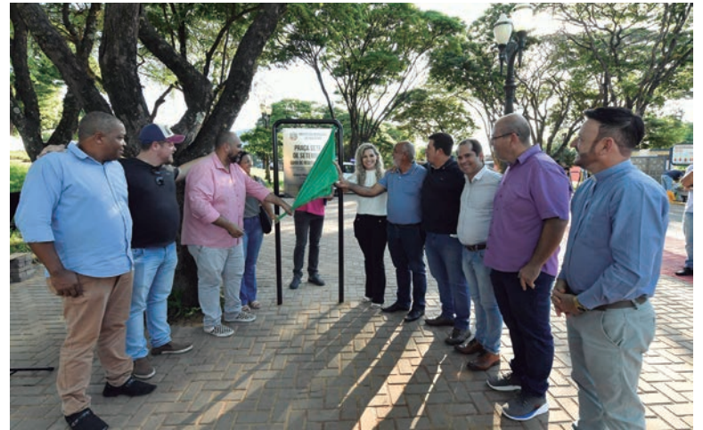
O investimento da Prefeitura na reforma foi de R$ 235,4 mil em recursos próprios, que proporcionaram melhorias em toda a área de 3,6 mil m 2 do logradouro