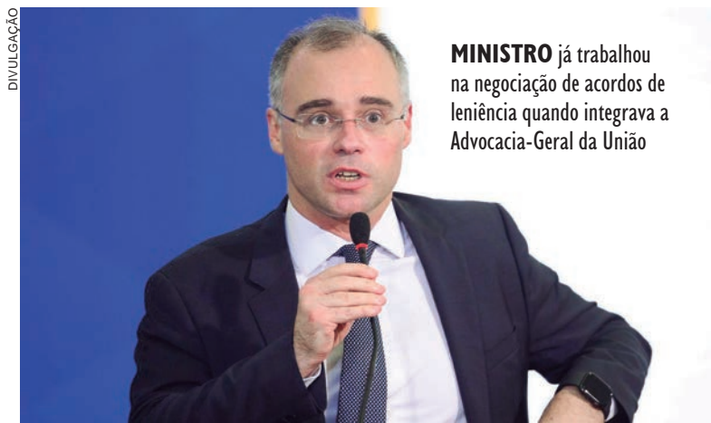
MINISTRO já trabalhou na negociação de acordos de leniência quando integrava a Advocacia-Geral da União

A ação foi protocolada no Supremo já com o pedido de distribuição para Gilmar Mendes, que é abertamente crítico da atuação da hoje extinta força-tarefa da Lava Jato e dos acordos negociados