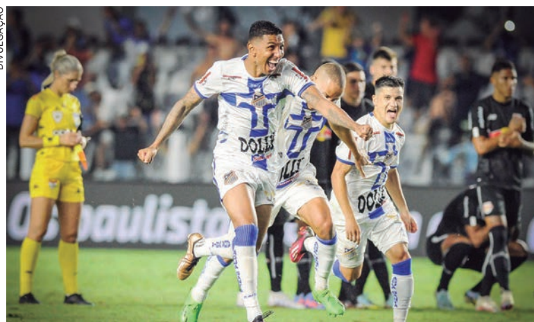
SENSAÇÃO do Estadual mais antigo do Brasil encara o Palmeiras na decisão