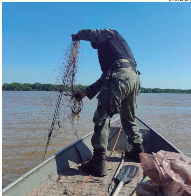
AS atividades desenvolvidas pela Polícia Ambiental estiveram dentro do contexto de várias outras operações desencadeadas junto com outras instituições

Ressalta-se ainda que durante o mês de março a Polícia Ambiental atendeu na área do Pelotão Ambiental de Umuarama, ocorrências de outras naturezas relacionadas a crimes ambientais, bem como crimes de natureza penal, como por exemplo: desmatamentos em área de proteção ambiental no bioma mata atlântica, maus tratos de animais domésticos e porte ilegal de arma de fogo.