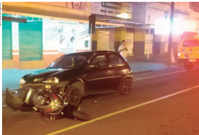
CONDUTORA do Corsa estava embriagada e foi detida em flagrante depois de colidir na traseira de motocicleta

foram atendidos pela PM, além de estarem visivelmente embriagados. As informações que chegaram aos policiais, davam conta de que a mulher estaria pedindo socorro na rua. Ela apresentava lesão na nuca, além das escoriações. Já homem possuía alguns arranhões. Na casa onde estava o acusado, os PMs encontraram uma pistola de calibre .45, regulamentada para posse. A arma foi apreendida.