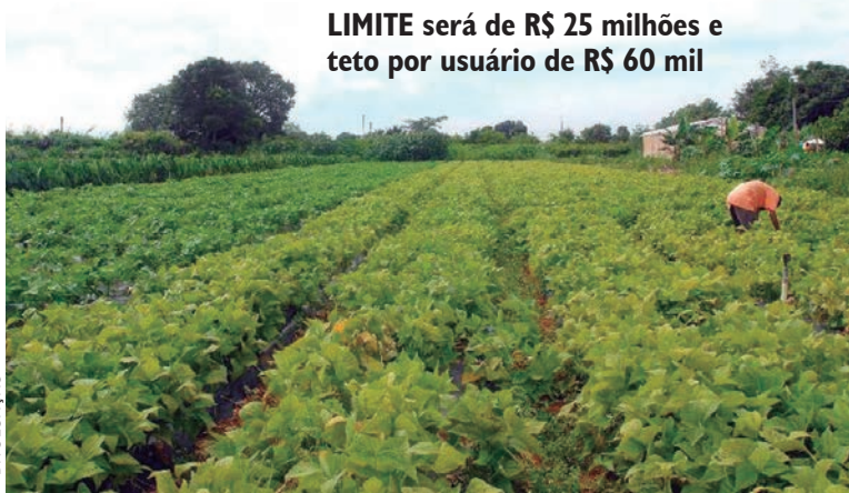
LIMITE será de R$ 25 milhões e teto por usuário de R$ 60 mil

O novo limite de R$ 25 milhões, no entanto, tem um teto de R$ 60 mil por associado ativo com Declaração de Aptidão (DAP) ou documento Cadastro Nacional da Agricultura Familiar do Programa Nacional de