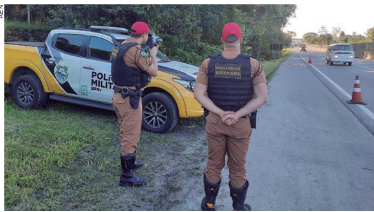
AÇÕES começam hoje, com policiamento ostensivo, de trânsito, nas vias, ruas, logradouros e espaços abertos e também nas rodovias do Estado

Também serão intensificadas as ações de patrulhamento ostensivo e preventivo, propiciando uma maior sensação de segurança à comunidade, fortalecendo a ação de presença real da Polícia Militar como forma de desestimular