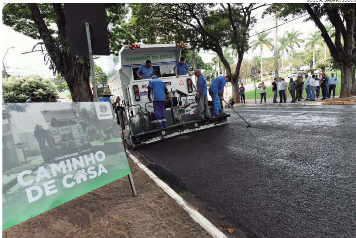
O programa chamado de Caminho de Casa teve demonstração prática de como o serviço será executado pelo caminhão usina

Pimentel lembrou obras que sua administração executa, atualmente, como a pavimentação de estradas rurais. “Estamos investindo R$ 5 milhões na Estrada Canelinha, R$ 3 milhões na Pavão e em breve R$ 3,5 milhões na Jurupoca. Iniciaremos três novas unidades