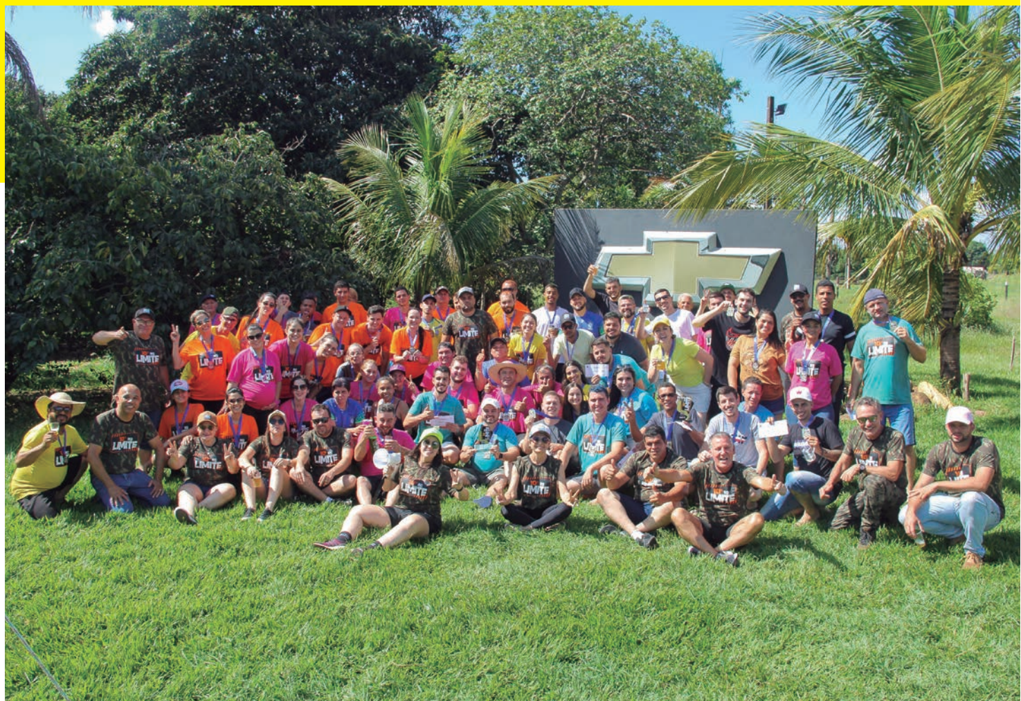
Funcionários Uvel Umuarama e Uvel Cianorte -, divididos em equipes e todo staff que coordenou as provas.