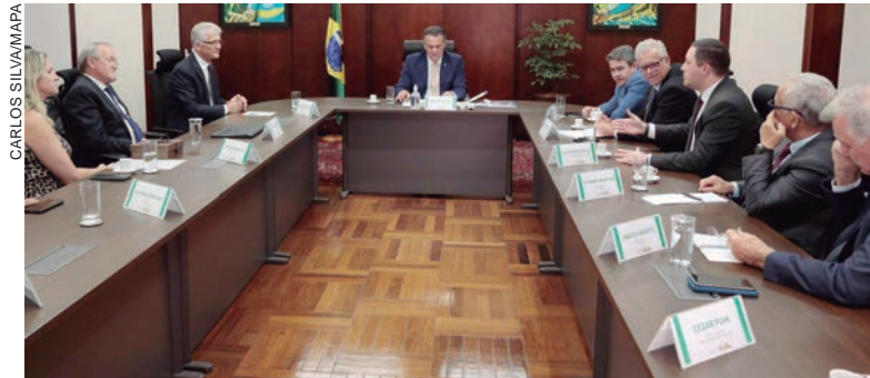
PARANAENSES em reunião com o Ministro, defendem as políticas para o agronegócio no Estado

A comitiva falou sobre algumas dificuldades do meio rural, em especial sobre a armazenagem. Foi apresentado ao ministro um levantamento acerca da alta ocupação destes espaços no Paraná. “Fizemos um pedido especial que seja contemplada a estrutura de armazenamento, e também infraestrutura e logística de transporte para absorver a safra”, explicou