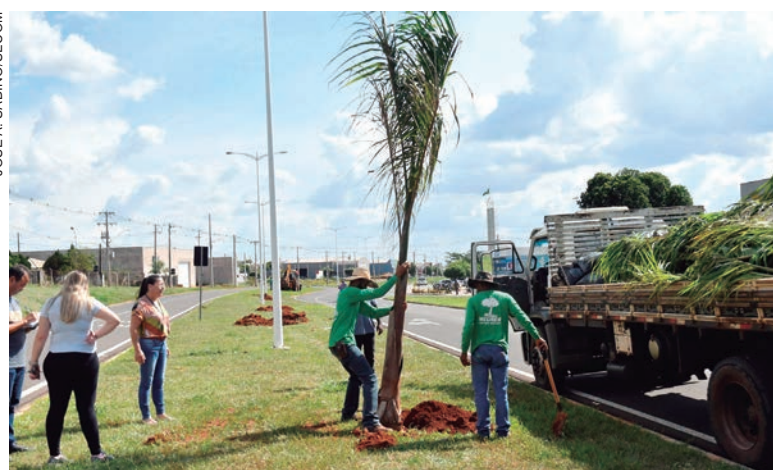
FORAM cultivadas 127 mudas, com uma média de cinco metros de altura

“Queremos embelezar as entradas da cidade. A Tiradentes teve uma grande remoção de árvores durante a revitalização e as palmeiras vão deixar a entrada da cidade mais agradável, mesmo caso da Ivo Sooma, que tinha um canteiro totalmente sem árvores. O plantio das palmeiras está transformando o visual