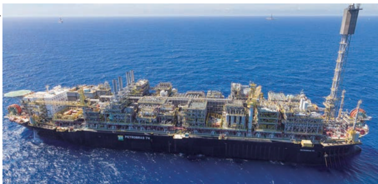
FOI a maior produção total já registrada, superando a de outubro de 2022, quando foram produzidos 4,180 milhões de boe/d

A produção no pré-sal bateu recorde em fevereiro deste ano, com 3,268 milhões de barris de óleo equivalente por dia (boe/d) que correspondem a 78,1% da produção brasileira, maior percentual de participação já registrado. O pré-sal está localizado em uma área de aproximadamente 149 mil quilômetros quadrados (km 2 ) no mar territorial entre os estados de Santa Catarina e Espírito Santo.