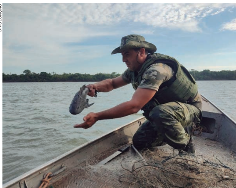
FORAM abordados 26 pescadores profissionais e amadores e quase 20 embarcações

à imprensa emitido pelo 2º Pelotão da Polícia Ambiental, a fiscalização também abordou 26 pescadores profissionais e amadores e quase 20 embarcações. O patrulhamento aquático também atingiu o rio Paranapanema, abrangendo Marilena e Diamante do Norte.