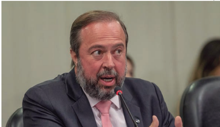
MINISTRO Alexandre Silveira defende mais autossuficiência em derivados

Mais cedo, em nota, a Petrobras reafirmou o