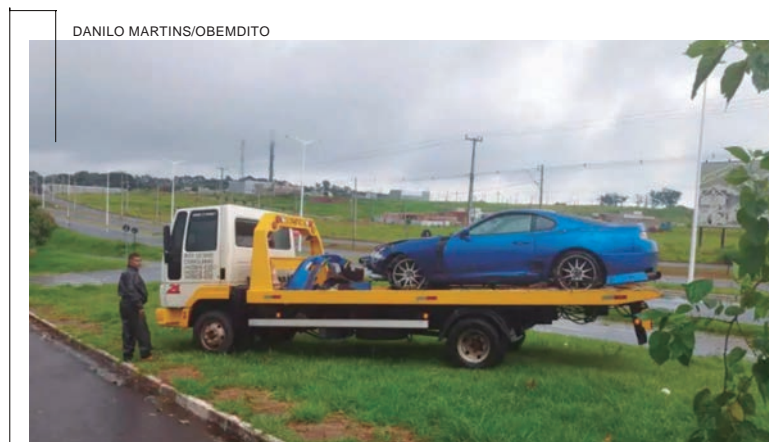
Um automóvel Toyota Supra foi parar em cima da ciclovia da avenida Portugal, de Umuarama, depois de se envolver em um acidente próximo ao trevo para Maria Helena, na tarde de ontem (6). O veículo teria aquaplanado na pista molhada. O esportivo era ocupado por duas pessoas e seguia sentido ao trevo, quando, à cerca de 150 metros do cruzamento o veículo aquaplanou, girou na avenida e foi parar em cima da ciclovia. O carro apresentou avarias e teve o para-choque arrancado com o impacto no gramado. Ele foi recolhido com auxílio de um guincho particular. O condutor e passageiro não se feriram com o acidente.

O 25º BPM repassou a ocorrência e as características do veículo para todos os órgãos de segurança da região, mas até o final da tarde da quinta-feira, não havia sido localizado.