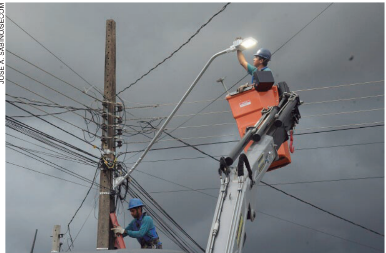
O investimento nesta etapa será de R$ 1.847.695,30 e prevê extensão de rede elétrica e substituição de 811 luminárias por LED