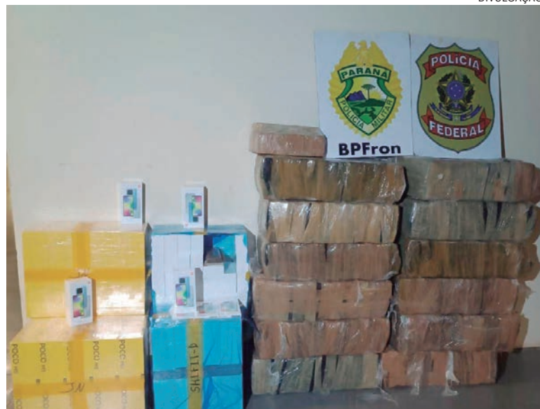
FORAM apreendidos em Perobal, 243 quilos de maconha e 200 telefones celulares contrabandeados do Paraguai

A mercadoria, o entorpecente, o caminhão e o condutor, foram levados à Delegacia da Polícia Federal de Guaíra.