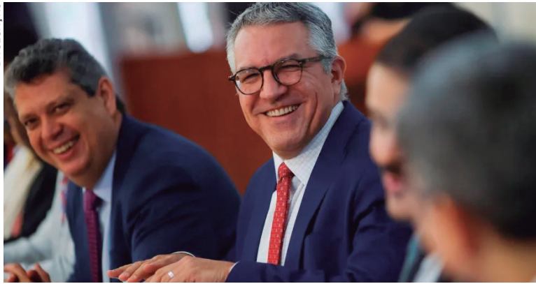
A ideia do ministro é centralizar a tramitação dos temas no Congresso em um único relator, o que facilitaria a negociação do governo com os parlamentares

A ideia é centralizar a tramitação dos temas no Congresso Nacional em um único relator, o que facilitaria a negociação do governo com os parlamentares.