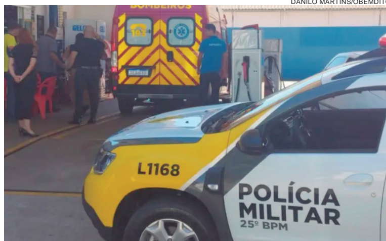
HOMEM esfaqueado foi atendido por uma equipe do Corpo de Bombeiros ainda no pátio do posto de combustíveis situado à rua Arapongas

A mulher acusada de ter praticado o crime chegou a perseguir o companheiro até o pátio. Ela conduzia um veículo Fiat Strada, mas foi espantada pelo funcionário do posto que disse estar acionando a Polícia Militar. A mulher então seguiu até a empresa e furou 3 pneus