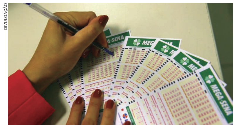
O banco não informou se os preços maiores das apostas aumentarão o valor dos prêmios

As apostas podem ser feitas até às 19h (horário de Brasília) do dia do sorteio em qualquer lotérica do país e também no portal Loterias Online. Clientes