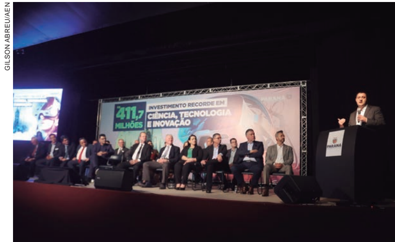
O intuito do governo é estimular o desenvolvimento de soluções inovadoras e promover a transferência de conhecimento acadêmico para o meio corporativo

O intuito é estimular o desenvolvimento de soluções inovadoras, promover a transferência de conhecimento acadêmico para o meio corporativo e reduzir obstáculos