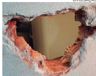
BURACO foi aberto na parede lateral da agência e por aí os bandidos tiveram acesso ao interior, de onde levaram o malote

Tudo então foi abandonado nas proximidades. Imagens de câmeras de monitoramento de empresas nas imediações estão sendo analisadas a fim de identificar os autores do crime.