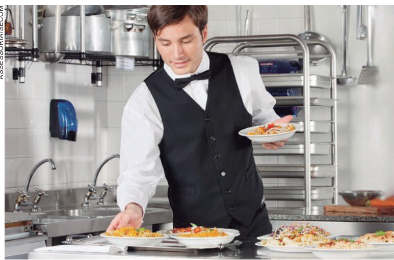
CURSO apresenta técnicas exclusivas para a satisfação dos clientes com objetivo de oferecer especialização gratuita aos profissionais

O diretor acrescenta que o curso ainda vai apresentar técnicas do uso da bandeja (bandeja redonda, bandeja retangular, transporte dos pratos, copos, garrafas e alimentos), tipos de serviços em alimentos e bebidas, serviço de buffet, empratados, inglesa direta e indireta, serviço de bebidas (serviço de vinhos) e sequência de serviço. “Outra parte muito importante do curso é