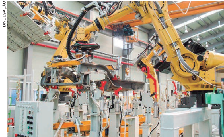
DOCUMENTOS tratam de economia digital e facilitação do comércio

“Há uma sinergia entre o projeto chinês Made In China 2025 e o pensamento do MDIC, recriado pelo presidente Lula.