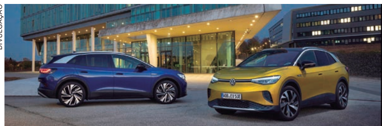
A Volkswagen está lançando uma nova geração do sistema propulsivo da família ID