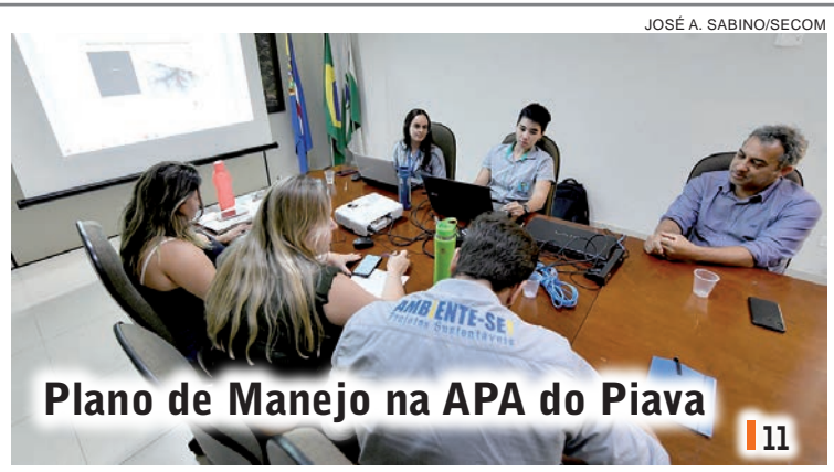
Plano de Manejo na APA do Piava