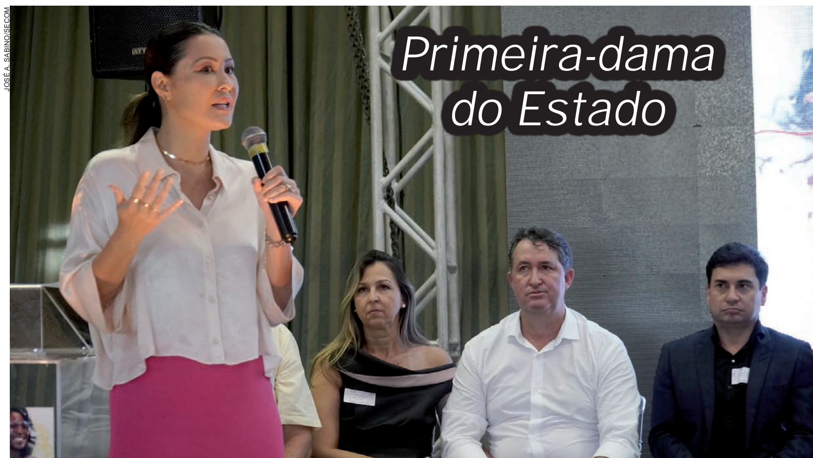
Primeira-dama do Estado