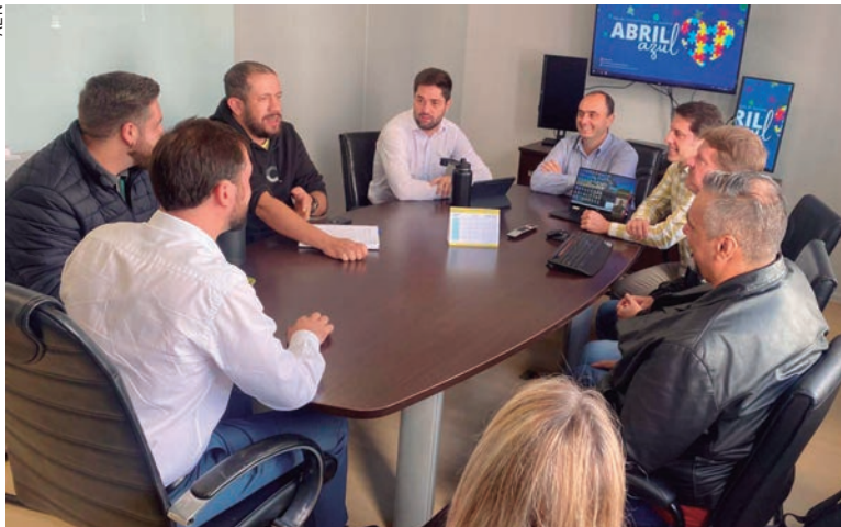
REUNIÃO entre a equipe da Lottopar e o consórcio vencedor, objetivou iniciar os trabalhos, apresentar equipes e desenvolver o plano