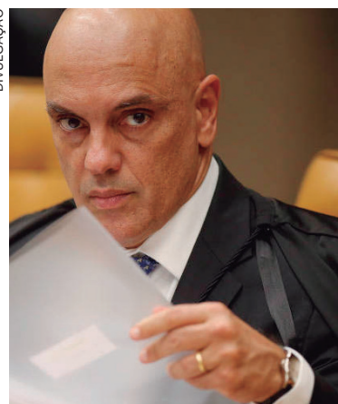
COM a decisão do ministro, também serão coletados materiais de investigados presos ou identificados em outros momentos da apuração sobre os atos

A avaliação do ministro é que ‘naturalmente, a autorização deverá compreender, ainda, os demais presos relacionados aos referidos atos golpistas, para completa elucidação dos fatos e precisa apuração da responsabilidade de cada um dos investigados’.