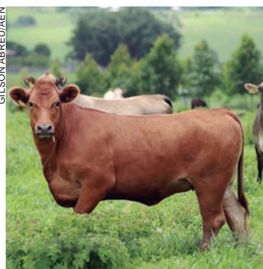
ALÉM da maior disponibilidade de animais, a proximidade com o inverno pode estar estimulando pecuaristas a venderem os rebanhos

O levantamento feito pelos técnicos do Deral aponta que, no atacado, os cortes dianteiro e traseiro são comercializados, em média, a R$ 15,43 e R$ 23,40, respectivamente.