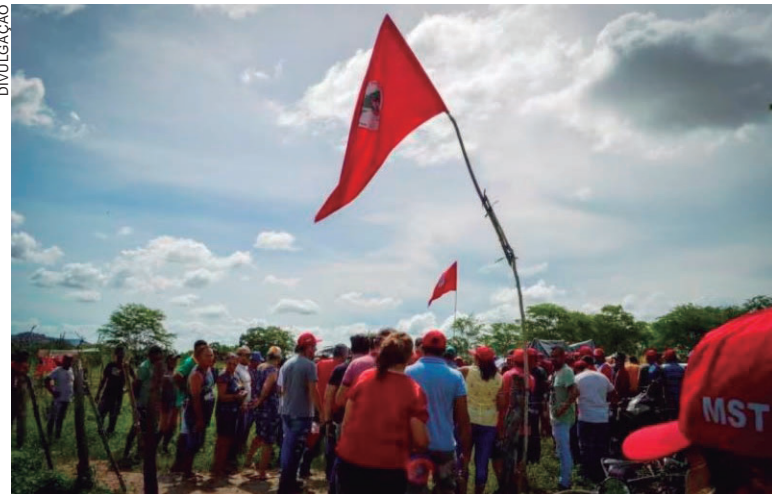
ÁREAS invadidas desde 3 de abril, continuam ocupadas, mesmo com a nomeação de apoiadores do movimento no Incra

Em janeiro, Alexandre já havia dado despacho similar,