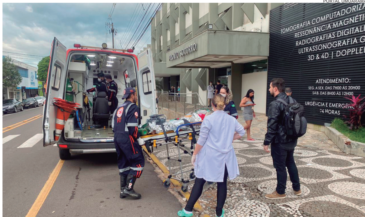
MULHER ferida foi levada pelo Samu ao hospital, depois do atentado. A sobrevivente foi ao IML ontem, onde passou por exames de corpo delito

A mulher foi socorrida pelo Samu e levada ao Hospital Nossa Senhora Aparecida. Desde então, equipes da Delegacia da Mulher realizaram