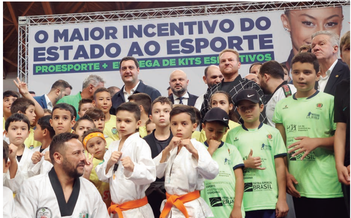
OS recursos anunciados serão destinados para uma série de programas estaduais como o Proesporte e o Geração Olímpica e Paralímpica

São seis categorias: formador escolar (402 vagas), destinada a atletas de 11 a 17 anos; técnico formador escolar (60 vagas), para técnicos que participaram dos Jogos Escolares do Paraná em 2022; estadual de Entidade de Administração do Desporto (400 vagas), para atletas de 11 a 21 anos, praticantes de modalidades olímpicas ou paralímpicas oficiais; técnico de Entidade de Administração do Desporto (70 vagas), para os técnicos que treinam atletas ou equipes no Estado de modalidades olímpicas ou paralímpicas oficiais; nacional (300 vagas),