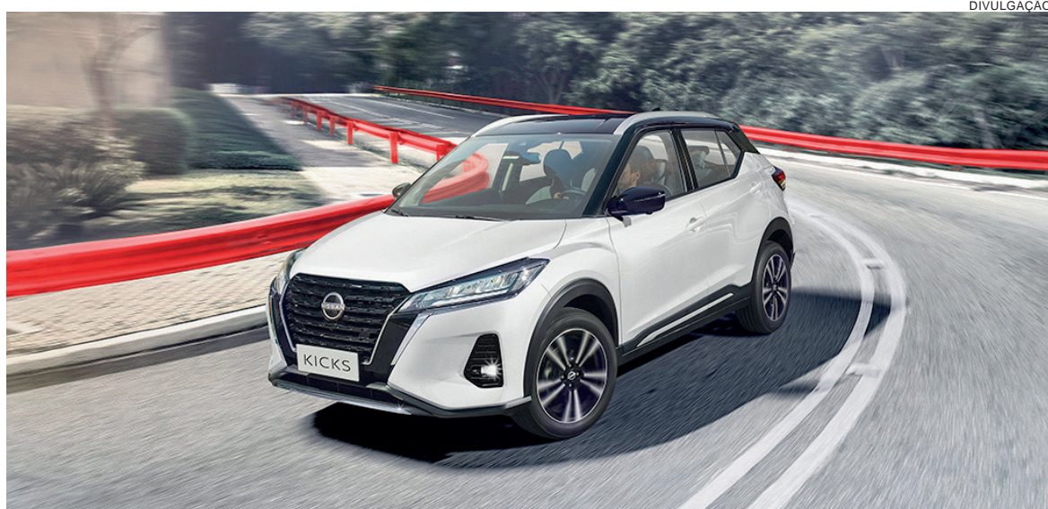
A linha 2024 do Nissan Kicks tem preço a partir de R$ 112.990.

Por dentro, o modelo apresenta recursos que aumentam