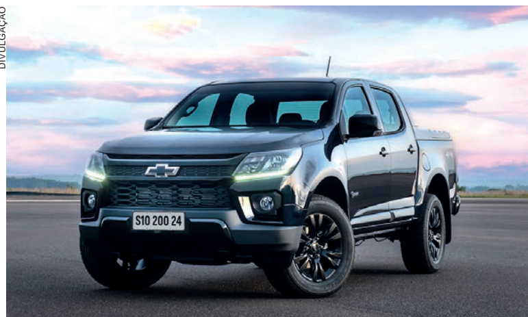
A Nova S10 Midnight traz um design exclusivo e arrojado, com detalhes escurecidos que conferem um visual mais sofisticado e esportivo à picape

Uma curiosidade: esta é a primeira vez que a Chevrolet utiliza um assistente virtual inteligente auxiliando na produção de conteúdo para lançamento de produto no Brasil.