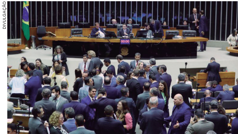
FORAM 325 votos favoráveis e 36 contrários ao parecer final, definido após negociação entre os líderes partidários