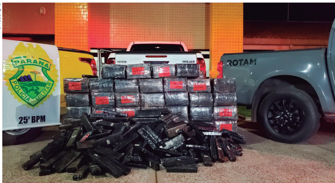
Garoto que já foi apreendido em outra ocasião por direção perigosa, conduzia uma Hilux carregada com a droga