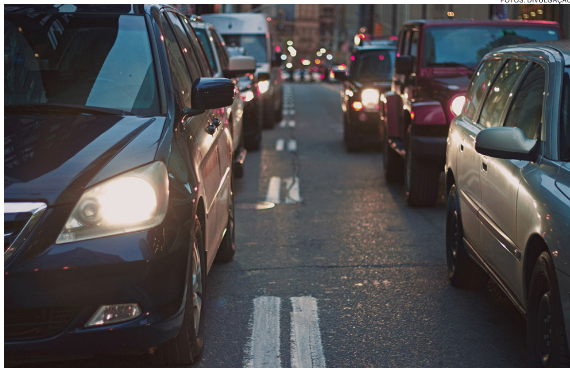
Falta de manutenção é mais um fator que contribui para aumentar o índice de mortalidade no trânsito. Veículos que não passam por manutenção periódica comprometem a segurança de todos.

O levantamento realizado anualmente pelo Sindicato Nacional da Indústria de Componentes para Veículos Automotores (Sindipeças) apontou que, em 2022, a frota de automóveis nas ruas brasileiras envelheceu pelo nono ano consecutivo. Atualmente, a média de idade dos veículos é de 10 anos e 9 meses. A marca é similar a 1994, quando a frota era apenas um mês mais jovem. “Carros que não passam por manutenção periódica comprometem a segurança de todos. Os