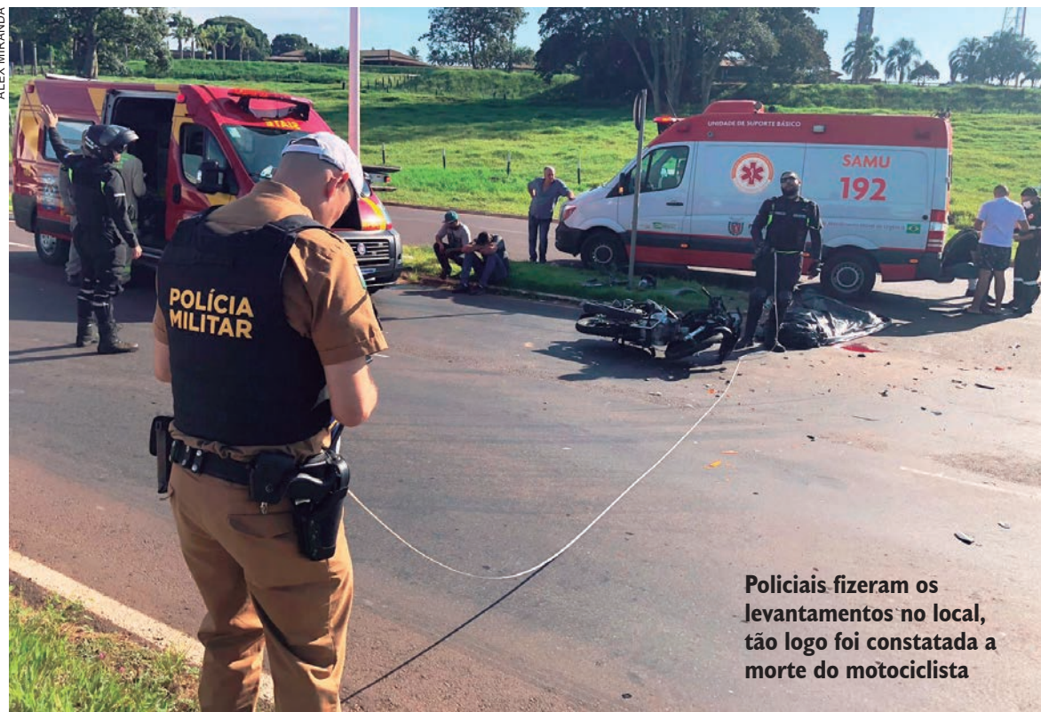
Policiais fizeram os levantamentos no local, tão logo foi constatada a morte do motociclista

Enquanto o piloto da moto era submetido aos procedimentos, ainda local, pouco a pouco familiares que ficaram sabendo do acidente, chegavam