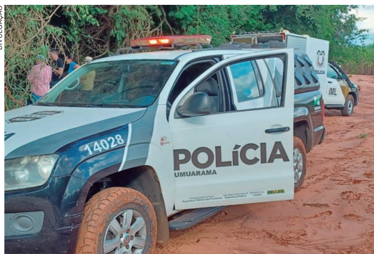
POLICIAIS civis localizaram os corpos enterrados no meio de uma lavoura de cana perto de uma mata em Tapejara

Os Institutos de Criminalística e Médico Legal de Umuarama foram acionados para coletar as evidências e