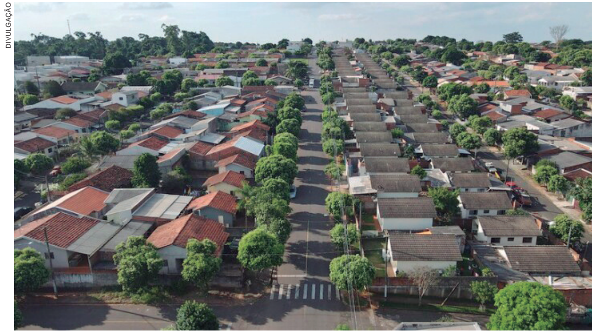
PROPRIETÁRIOS de imóveis que não estão regularizados devem procurar apoio na Secretaria de Habitação