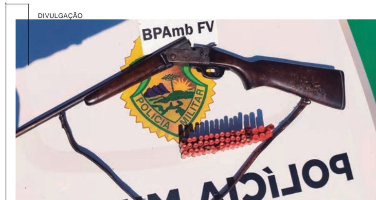
A Polícia Ambiental de Umuarama prendeu um homem de 62 anos que foi flagrado em posse irregular de uma espingarda calibre 36 e 40 munições, ontem (5), em Altônia. Os policiais foram até o local para apurar uma denúncia envolvendo caça. A ação aconteceu no Jardim Ouro Verde. A equipe foi recebida pelo denunciado, de 62 anos de idade, que, ao ser questionado, confirmou que possui a arma de fogo para caçar, porém não conseguiu abater nenhum animal. Sobre a arma, ele afirmou que possui a espingarda calibre 36 e diversas munições. O homem recebeu voz de prisão e foi encaminhado a Delegacia de Polícia Civil.

A iniciativa, desenvolvida no bojo do projeto "PCPR na Comunidade", busca aproximar a população do trabalho da polícia, ofertando um atendimento mais acessível e de excelência.