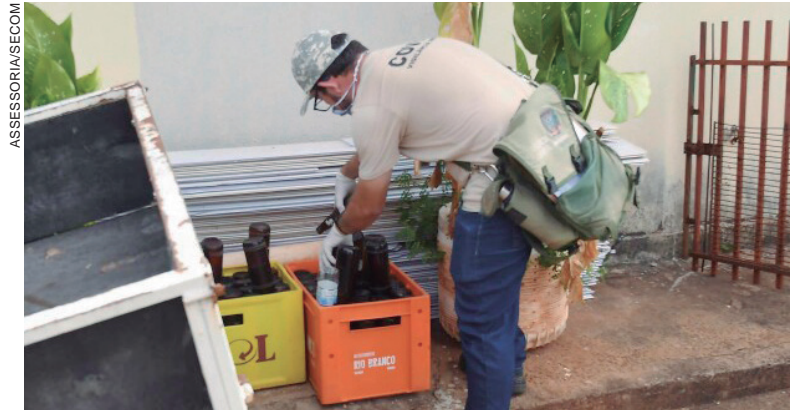
O acumulado de casos subiu de 171 para 201 na semana, quando foi confirmada também a primeira morte em decorrência da dengue no município

em surto, bem como a UBS do distrito de Vila Nova União (4), enquanto outras 13 unidades básicas de saúde seguem em situação de alerta – Jardim Cruzeiro (17 casos), Bem-Estar (16) e Posto de Saúde Central (15) são as regiões mais críticas. A morte registrada em Umuarama – de um paciente de Vila Nova União – aguarda ainda a confirmação do comitê estadual de acompanhamento da dengue, da Secretaria de Estado de Saúde (Sesa).