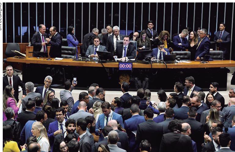
PACHECO define que, em relação às bancadas partidárias, deve ser considerada a composição vigente na primeira reunião

Em decisão publicada na edição de ontem (5) no Diário do Congresso Nacional, Pacheco define que, em relação às bancadas partidárias, deve ser considerada a composição vigente na primeira