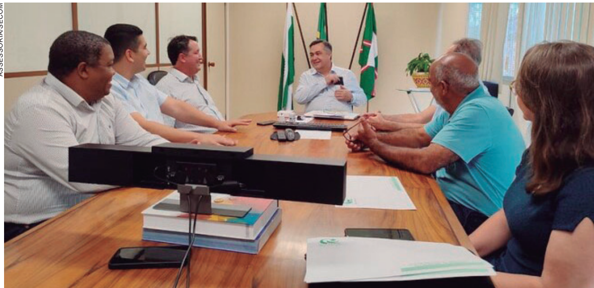
SECRETARIA de Saúde vai utilizar veículos para tratamentos de pacientes fora do domicílio

Os ônibus têm capacidade para 36 passageiros e custaram R$ 615 mil cada – totalizando R$ 1.230.000 –, já a van tem capacidade para transporte de 15 pessoas e custou R$ 294.500. “Esse investimento que o Governo do Estado está fazendo nos municípios, por