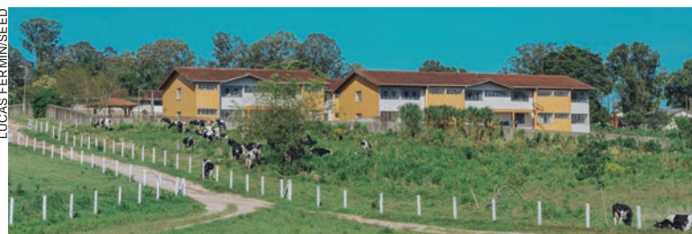
A intenção é dar mais autonomia às fazendas-escola da rede estadual do Paraná que conta com 23 colégios agrícolas

A intenção desse projeto é dar mais autonomia às fazendas-escola, uma vez que hoje os colégios e esses espaços encontram algumas dificuldades para seu bom funcionamento, pois a realidade do campo – como o tempo dos ciclos das culturas vegetais