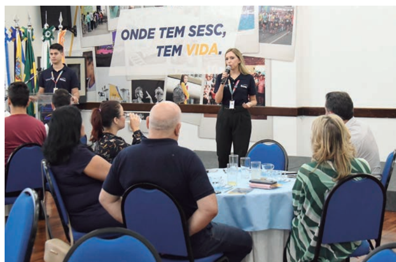
O Dia do Desafio busca despertar a consciência da população sobre os efeitos do sedentarismo e as vantagens de uma vida saudável

campanha como ferramenta para sensibilizar gestores públicos e instituições a desenvolverem projetos comunitários com foco em esportes, atividades físicas e mobilidade urbana, utilizando conteúdos que estimulem a ocupação de espaços urbanos voltados às pessoas. O registro da participação poderá ser presencial ou virtual, de 0h às 21h do dia 31 no site sescpr.com.br .