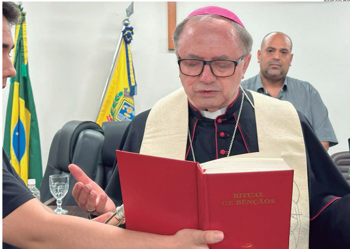
A visita do bispo faz parte do calendário Diocesano, como uma das atividades que compõem as comemorações do Jubileu de Ouro da Diocese

O Concílio Vaticano II, forte sopro do Espírito Santo sobre a Igreja, convocado pelo Beato João XXIII, em 1962, e concluído sob o Papa Paulo VI, em 1965, inaugurou um tempo novo. Nesta época, os Bispos do Brasil já haviam iniciado a