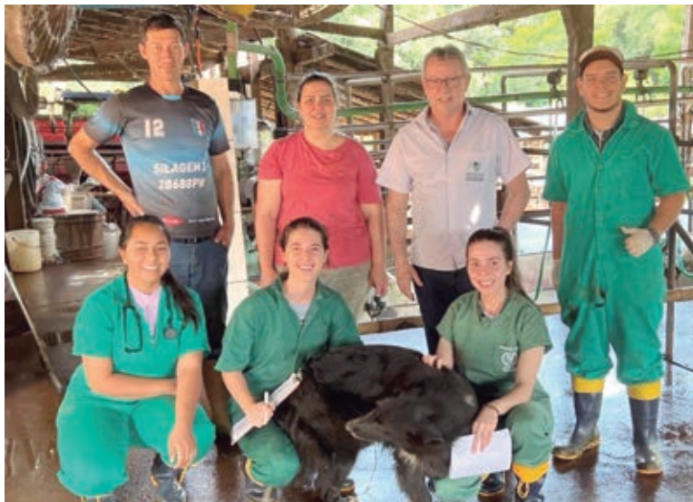
TRABALHO foi realizado em parceria com a Universidade Federal da Fronteira Sul, e identificou bactérias que provocam redução do volume e da qualidade do leite

As propriedades que participaram da pesquisa foram selecionadas entre aquelas que são assistidas pelo IDR-Paraná. Os produtores receberam a visita