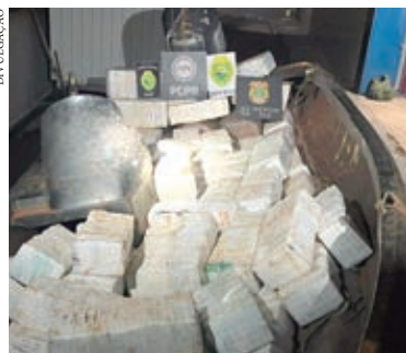
AÇÃO foi executada por equipes do BPFron e do Bope, com apoio de policiais federais do Núcleo Especial de Polícia Marítima e policiais civis do Paraná

A Operação Divisas e Fronteiras Integradas reúne Fronteiras Integradas reúne policiais federais do Núcleo Especial de Polícia Marítima e policiais civis do Centro de Operações Policiais Especiais (Cope).