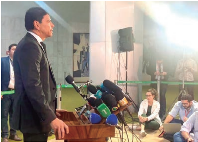
O TEXTO de Cajado estabelece a adoção de medidas automáticas de controle de despesas obrigatórias

O arcabouço fiscal é um conjunto de medidas, regras e parâmetros para a condução da política fiscal – controle dos gastos e receitas de um país. O governo busca, com isso, garantir credibilidade e previsibilidade para a economia e para o financiamento dos