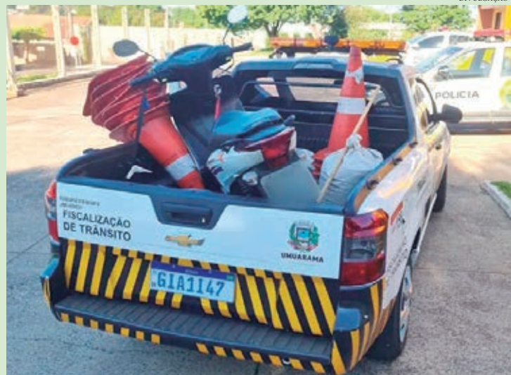
HONDA Biz foi abordada aleatoriamente pelos agentes de trânsito nas proximidades da Prefeitura de Umuarama

Os agentes realizaram a abordagem aleatoriamente e constataram essa grande quantidade de multas. A condutora foi qualificada e liberada em seguida. O veículo foi encaminhado para o 25º Batalhão da Polícia Militar (BPM) e levado ao pátio.