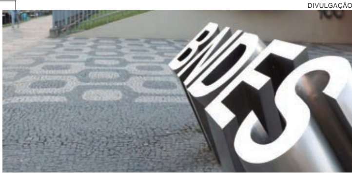
O lucro líquido do Banco Nacional de Desenvolvimento Econômico e Social (BNDES) no primeiro trimestre foi de R$ 1,7 bilhão, uma queda de 28,4% em comparação a igual período de 2022. Em relação ao último trimestre de 2022, a diminuição foi de 51%. Os dados foram divulgados ontem (terça-feira, 16). Os desembolsos do banco no primeiro trimestre do ano somaram R$ 19,1 bilhões, 29% superior ao registrado no mesmo período do ano passado, mas 44,8% abaixo dos últimos três meses de 2022. O setor da indústria foi o que mais recebeu desembolsos do banco, um total de R$ 6,1 bilhões, seguido pela infraestrutura, R$ 5,5 bilhões; comércio e serviços, R$ 3,8 bilhões; e agropecuária, R$ 3,7 bilhões.

grandes empresas de títulos privados, basicamente esse mercado travou. Ficou mais caro e mais difícil para as empresas se refinanciarem no mercado de capitais", argumentou Tobias.