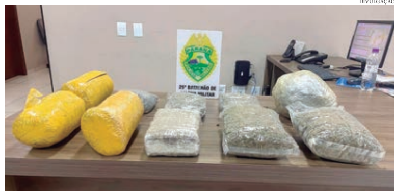
DROGA tinha como destino o Estado de Santa Catarina, mas parou na rodoviária nova de Umuarama

Mesmo assim, foi conduzida à Delegacia de Polícia de Umuarama, onde foi autuada e presa em flagrante, sob a acusação de tráfico. Na verificação a sua identidade, foi descoberto que ela não possui antecedentes criminais. Foi colocada à disposição da Justiça.