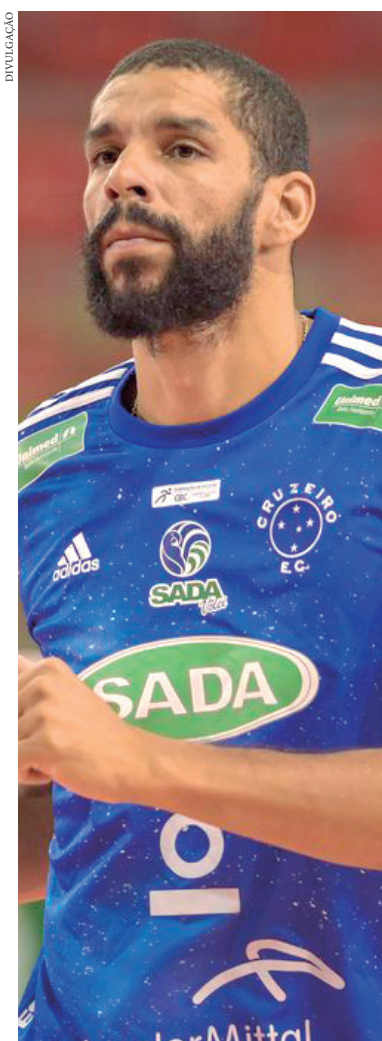
CONSENSO entre COB e CBV reduz punição de atleta para 90 dias

O jogador do Cruzeiro, no entanto, foi liberado em meados de abril para jogar a reta final da Superliga, por medida liminar concedida pelo Superior Tribunal de Justiça Desportiva (STJD). Depois disso, o Conselho de Ética do COB não só elevou de 90 dias para cinco anos o afastamento do atleta das quadras, como também suspendeu por seis meses o repasse de verbas pública à CBV. Com a redução da pena, Wallace cumpria o restante da pena durante suas férias.