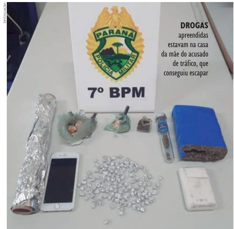
DROGAS apreendidas estavam na casa da mãe do acusado de tráfico, que conseguiu escapar

Ao fim, as drogas foram recolhidas e encaminhadas para a Delegacia Regional de Cruzeiro do Oeste.