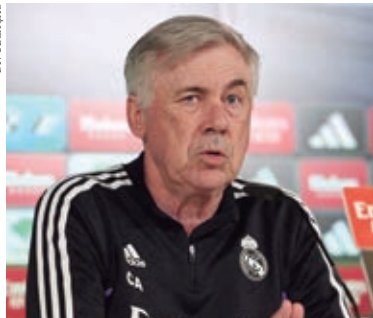
TÉCNICO do Real espera que Vini Jr siga no clube, apesar dos insultos

Os reiterados ataques sofridos pelo atacante Vinicius Junior no Campeonato Espanhol foram o tema principal da entrevista coletiva do técnico do Real Madrid Carlo Ancelotti, ontem (23), véspera do duelo do Real Madrid contra o Rayo Vallecano. O treinador italiano foi enfático ao criticar os atuais protocolos adotados por autoridades para lidar com os insultos racistas em eventos