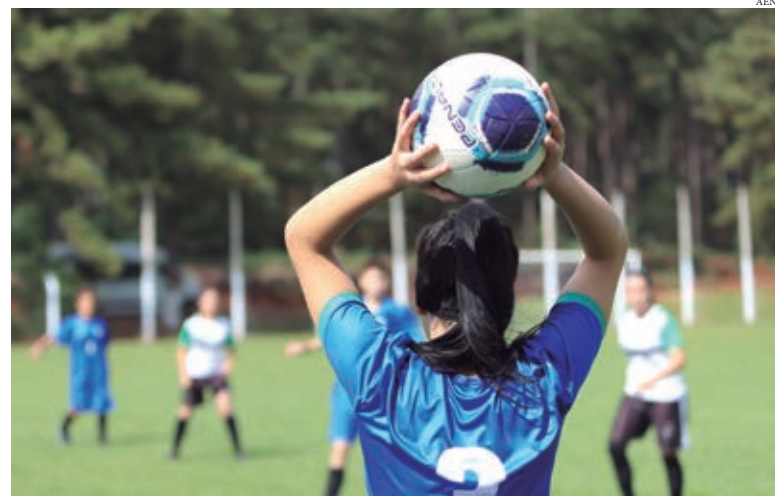
ESTA É A SEGUNDA chamada para projetos a serem executados em 2023, passando para 107 o número de contemplados e o valor total do edital chega a R$ 14 milhões

As inscrições estarão abertas de 25 de maio a 24 de julho. Os interessados em inscrever projetos deverão ficar atentos ao conteúdo do edital, com toda a documentação anexada na plataforma de inscrição.