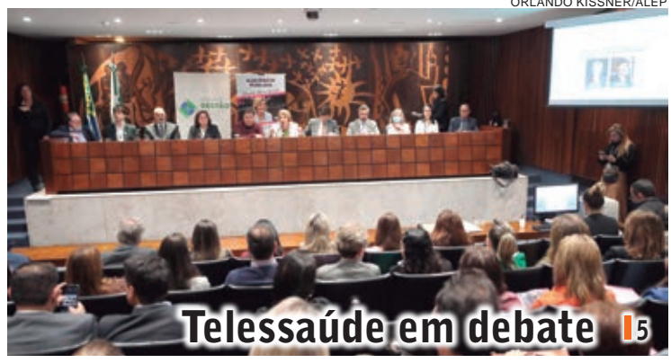
Telessaúde em debate | 5