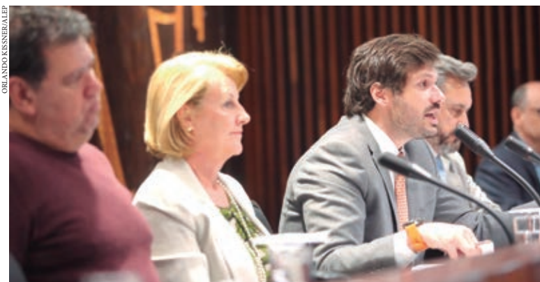
O PROJETO se encontra sob análise da Comissão de Constituição e Justiça, seguindo os trâmites regimentais até votação definitiva em Plenário