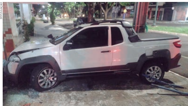
VEÍCULO invadiu a calçada depois de colidir contra olixreira da prefeitura e parou na parede de uma revendedora de motos

prisão e foi encaminhado à 7ª Subdivisão Policial de Umuarama, e possivelmente