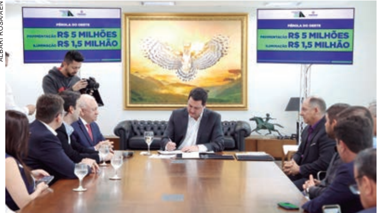
PORTO AMAZONAS receberá R$ 5,3 milhões, Esperança Nova R$ 2,6 milhões e Pérola do Oeste, R$ 5,1 milhões e R$ 1,5 milhão para iluminação de LED

nessas 155 cidades”, acrescentou o governador.