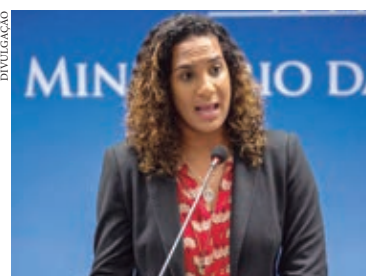
Em nota, governos repudiam ofensas sofridas pelo jogador Vini Júnior

No texto, as autoridades exigem providências imediatas e contundentes. “É obrigação de todas as instituições competentes responderem com a maior