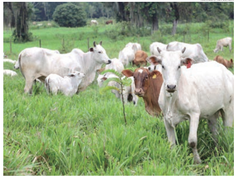
A CONQUISTA é fruto de mais de 50 anos de trabalho e parceria entre iniciativa privada, entidades representativas do agronegócio e governo estadual

“Chegamos ao mais alto grau de qualidade sanitária do planeta, com a garantia de segurança alimentar. Todo mundo que fala de comida, fala necessariamente com o Paraná”, destacou o governador Carlos Massa Ratinho Junior. “A certificação é vitória de várias pessoas, públicas ou não, e construída por várias mãos. Nossa missão agora é que isso se reverta em empregos e crescimento econômico”.