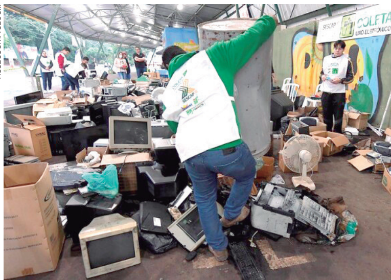
PROJETO da Secretaria de Meio Ambiente já arrecadou 137 toneladas de materiais que poderiam ter sido jogados na natureza

O evento é realizado pela Prefeitura, por meio da Secretaria de Meio Ambiente, em parceria com o Sescap (Sindicato das Empresas de Serviços Contábeis, Assessoramento, Perícias, Informações e Pesquisas do Paraná), Coopera (Cooperativa dos Catadores de Recicláveis), Unipar (Universidade Paranaense), Instituto Federal do Paraná (IFPR), UniAlfa, Sanepar e Sesc.