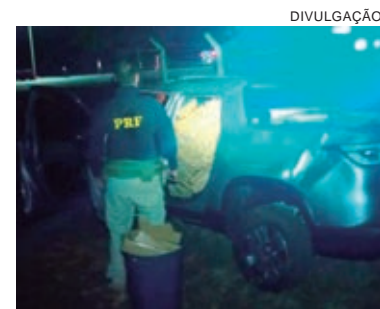
DROGA era transportada na cabine e na carroceria do veículo que foi apreendido pela PRF de Alto Paraíso

A Polícia Rodoviária Federal (PRF) realizou a apreensão de quase 1,2 tonelada de maconha por volta das 20h40 da quinta-feira (25), em Alto Paraíso. A ação aconteceu na rodovia BR-487 e ninguém foi preso.