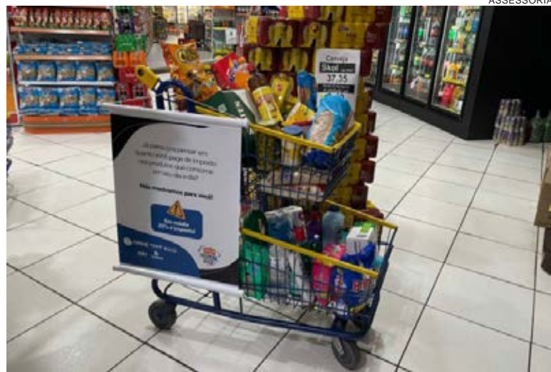
DURANTE o evento, haverá comercialização de produtos sem a cobrança dos tributos (federal e estadual) principalmente

O Dia D da campanha de conscientização contará com a ‘Blitz do Imposto’ (entrega de flyers e copos), carreata, exposição de um carro em um guincho na área central e a ‘Feirinha sem Imposto’, que propiciará aos visitantes uma interessante imersão, com a