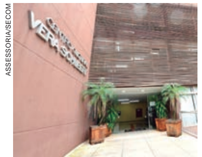
A CONFERÊNCIA será palco de discussão sobre a cultura, promovendo contatos e valorizando a diversidade e propondo estratégias de acesso aos serviços culturais