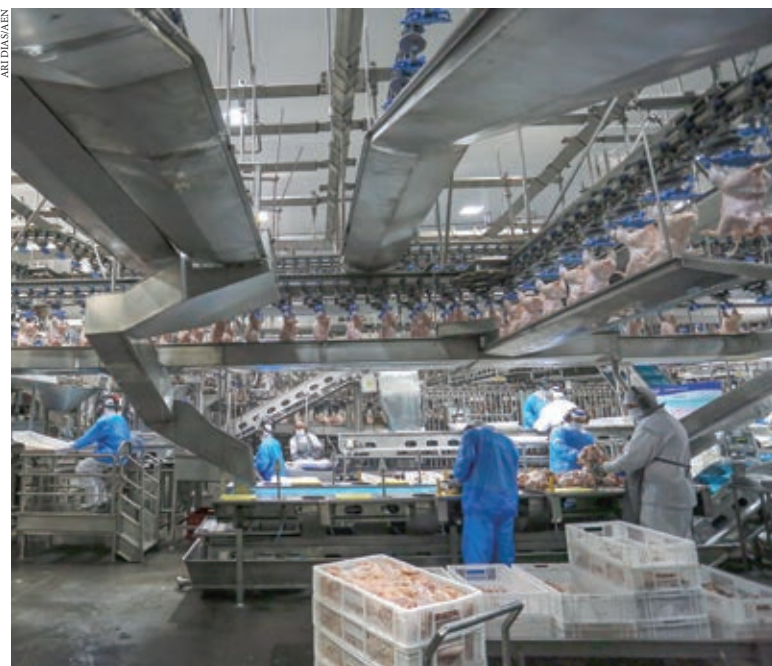
CERTIFICAÇÃO de livre da aftosa sem vacinação e da peste suína clássica de forma independente completa dois anos com ampliação do mercado exterior

a importância do trabalho conjunto entre as forças políticas, econômicas e produtivas para a conquista da condição de livre de febre aftosa sem vacinação. E acentuou o esforço conjunto para a prospecção de mercados.