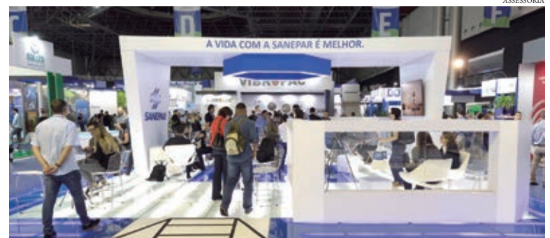
NO ESTANDE montado na Feira Fitabes, os visitantes conhecem detalhes das áreas de atuação da empresa, apresentados pelos técnicos da Companhia