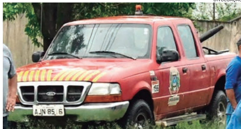
CAMINHONETE Ranger vermelha, na foto aparece com a logomarca da Prefeitura, mas segundo a postagem, no dia do crime estava sem os adesivos

Ainda teria sido vítima de um espancamento no dia 26 de março em um depósito do Jardim