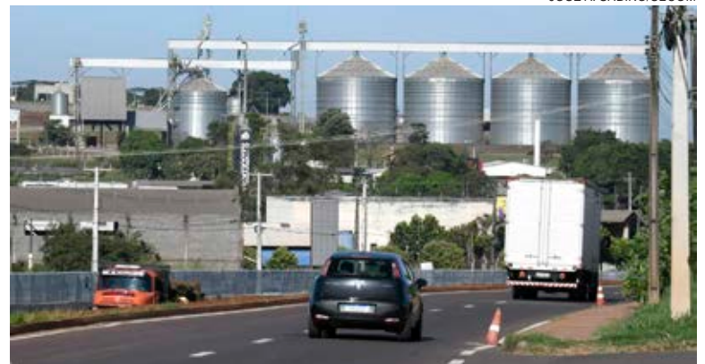
O PRODEU oferece concessão dos terrenos com possibilidade de doação futura, caso os critérios sejam cumpridos dentro dos prazos e condições estabelecidas

A indústria foi o setor econômico que mais cresceu em Umuarama nos últimos anos. Dados do Cadastro Geral de Empregados e Desempregados (Caged) do governo federal mostram que o setor foi o que mais contratou mão de obra em 2021 e 2022, além de manter o estoque de empregos, diferente da evolução notada no Estado e no país – onde o setor de serviços e a construção foram os mais fortes.