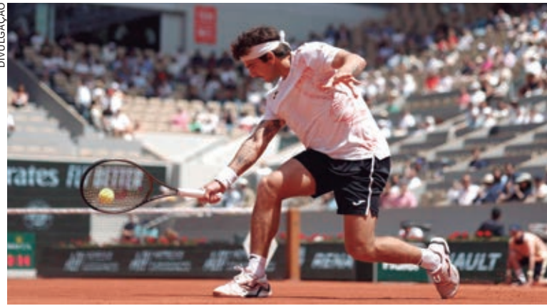
ELE É o segundo brasileiro, depois de Guga Kuerten, a vencer um top 2 em Grand Slam

O brasileiro garantiu a vaga na chave principal de Roland Garros após vencer três duelos, o último deles contra o alemão Dominik Koepfer (102º no ranking) por 2 sets a 0, na última rodada do qualificatório. Já Medvedev chegou a Paris, como segundo cabeça de chave, após a conquista no Masters 1000 de Roma. Ele sonhava com a conquista do Grand Slam parisiense para assumir o ranking da Associação de Tenistas Profissionais (ATP).