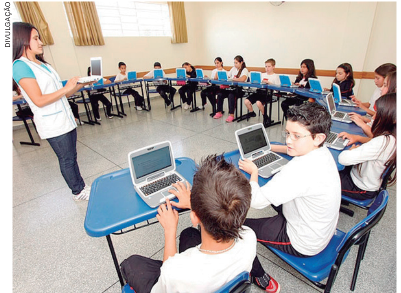
AS MUDANÇAS asseguram que novos contratos e prorrogações de uso de radiofrequência sejam condicionadas ao investimento na implantação da internet nas escolas públicas

O objeto é a cooperação recíproca dos associados para promover e estimular o desen-