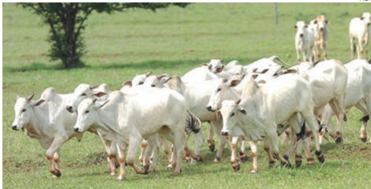
A REGIONAL da Adapar de Umuarama registrou no primeiro mês de campanha de atualização do rebanho, um registro de 51,5% do gado local

A atualização é exigida para todas as espécies de animais de produção existentes na propriedade (bovinos, búfalos, equinos, asininos, muaras, suínos, ovinos, caprinos, aves, peixes e outros animais aquáticos, colmeias de abelhas e bicho-da-seda). Os produtores podem fazer de forma