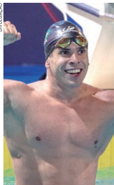
COMPETIÇÃO será disputada entre os dias 31 de julho e 6 de agosto

“Acredito que nosso grupo esteja bem preparado. É bem experiente. Não há nenhum estreante em Mundial. A expectativa é muito boa para que a seleção tenha um bom desempenho. Estamos em um nível competitivo alto durante