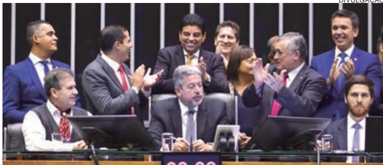
COM A aprovação, o presidente Arthur Lira, e a cúpula da Casa pretendiam passar um recado ao Supremo Tribunal Federal