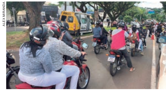
ÚLTIMA ação dentro do Maio amarelo diretamente no trânsito, levou autoridades a abordar e apreende motos irregulares no centro de Umuarama

A campanha teve um resultado excelente. Foram distribuídos cerca de 10 mil panfletos e centenas de cidadãos foram conscientizados por meio de palestras e outras