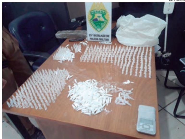
DROGA encontrada na residência foi recolhida pela Polícia Militar e casal foi denunciado por tráfico de drogas

O casal que recebeu voz de prisão, foi encaminhado, junto com a droga para a 7ª Subdivisão Policial (SDP) de Umuarama.