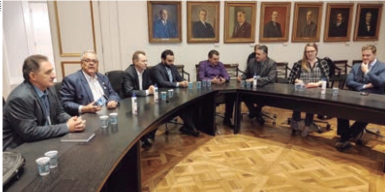
O DESCOMPLICA Paraná visa o desenvolvimento de mecanismos para desburocratização para abertura de empresas e emissão de licenças e alvarás

Um dos pontos importantes é a automatização da consulta prévia feita pela futura empresa para averiguar a viabilidade de localização do novo empreendimento. Alguns