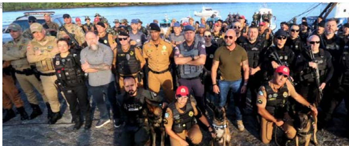
SETE MIL policiais estão fiscalizando 128 pontos terrestres, marítimos e aéreos nas divisas e fronteiras com o objetivo de combater diversos tipos de crimes