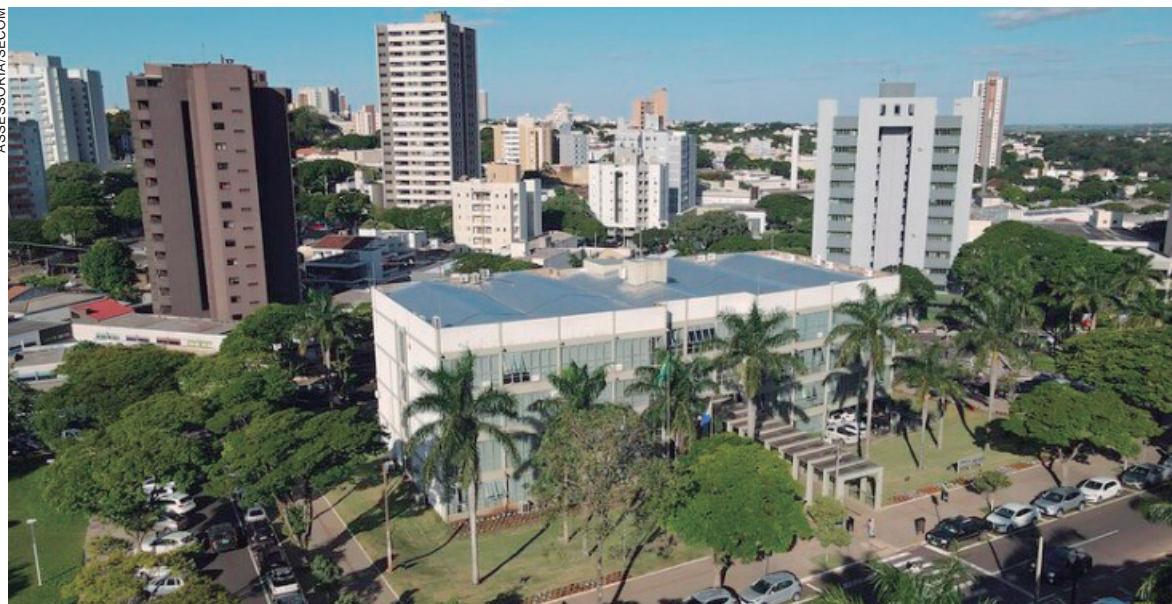
Pausa após o Corpus Christi foi aprovada por decreto que estabelece que serviços essenciais não sofrem paralisação