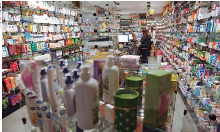
IBGE registra recuo nos transportes, com queda nas passagens aéreas

O grupo com o maior peso na inflação é Alimentação e Bebidas, que ficou 0,16% mais caro em maio, desacelerando em relação ao 0,71% registrado em abril. As maiores variações foram no preço do tomate, que subiu 6,65% no mês, após alta de 10,64% no período anterior. O chocolate em barra e bombom passou de queda de 0,22% em abril para