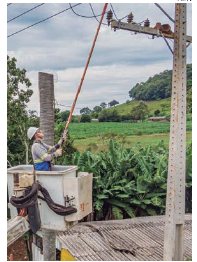
A Copel já investiu mais de R$ 1 bilhão – do total de R$ 2,8 bilhões previstos até o final do programa – na construção de redes trifásicas

No Oeste do Estado, a Copel já entregou 2.167 quilômetros de novas redes. Cascavel é o principal município beneficiado na região, com 214 km de redes, seguido por Guaraniaçu, com 129 km; e Toledo, com 94 km. Vizinha do Oeste, a região Noroeste já recebeu 2.072 quilômetros de redes. Nova Cantu já conta com 94 km de cabos, Mandaguari, com 89 km e Campina