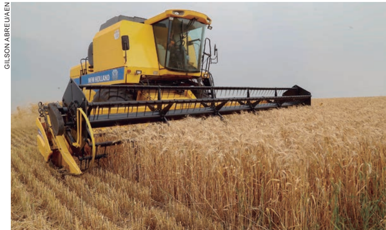
O trigo, principal cultura do outono/inverno paranaense, já está semeado em 75% da área estimada de 1,38 milhão de hectares

Os produtores de feijão já colheram 54% dos 299 mil hectares cultivados. Ainda que a falta de chuvas ajude nesse processo e na qualidade do pro-