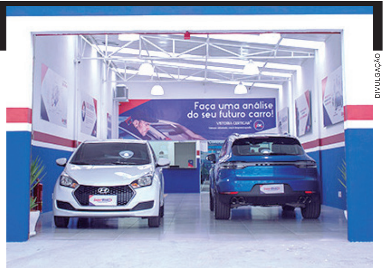
O primeiro indício para saber se seu veículo foi clonado ou não, está no recebimento de infrações que o condutor não cometeu

Exija que seja feita uma vistoria veicular no veículo, obviamente por uma empresa confiável e idônea; é feita uma análise completa do carro que vai desde a verificação dos itens de identificação, análise estrutural e de funcionamento