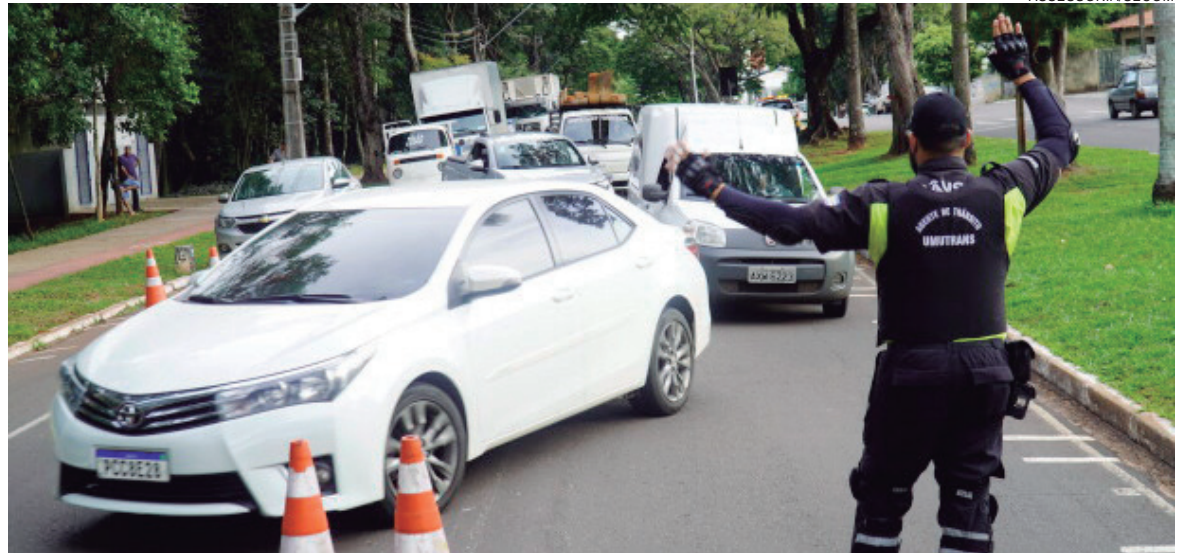
As blitzes foram realizadas em conjunto entre a Guarda Municipal, agentes da autoridade de trânsito do município e a Polícia Militar, em locais estratégicos da cidade

E ainda condutores não habilitados, com CNH cassada ou suspensa (58 multas), transporte de criança sem observância das normas de segurança (30), transitar pela contramão de direção (19) ou com o veículo sobre a calçada (sete casos), executar operação de retorno em local proibido (16 autuações), avanço de sinal vermelho de semáforo (11 multas), falta de uso de capacete (17 autuações) e outras infrações resultaram em 92 autuações.