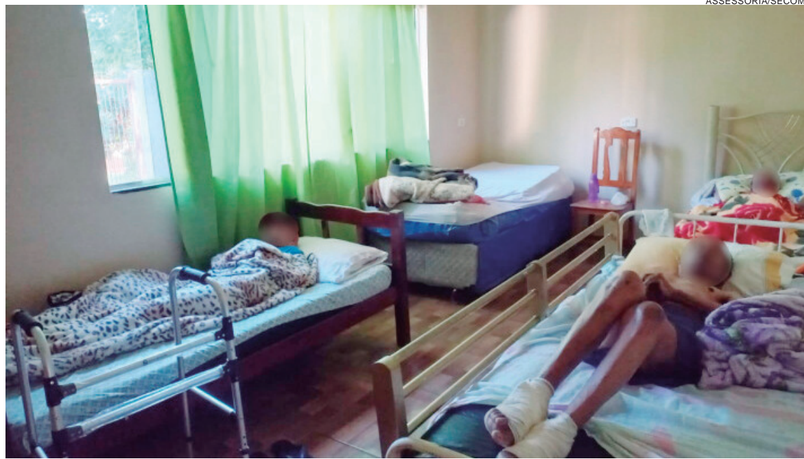
Abrigo clandestino que funcionava no Tarumã recebeu internos de outra casa que havia sido interditada há um mês

De acordo com a equipe, a proprietária do abrigo irregular mantinha outra casa atendendo clandestinamente na região do Alto São Francisco. Lá o estabelecimento também foi interditado há cerca de 30 dias. “Na época, após a autuação, ela informou que havia retirado todos os idosos de lá, mas na verdade apurou-se que ela montou outra casa clandestina no Parque Tarumã e abrigou novamente esses idosos, que são de famílias de