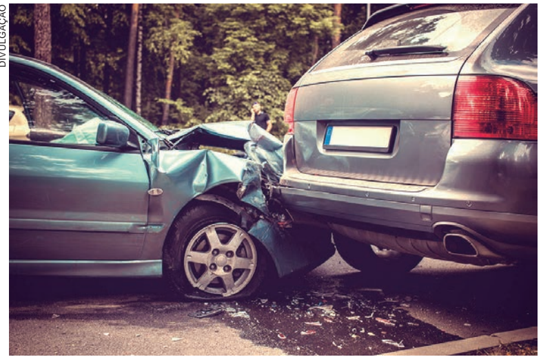
A videotelemetria é capaz de identificar se o motorista faz uso de cigarro, celular, se está distraído, com sono ou arriscando ultrapassagens perigosas

“Com a videotelemetria é possível acompanhar incidentes de fadiga, uso do celular, cigarro, distrações e outros comportamentos prejudiciais que podem acarretar risco tanto para quem dirige, quanto para terceiros. Com as novas tecnologias, principalmente a inteligência artificial, é possível