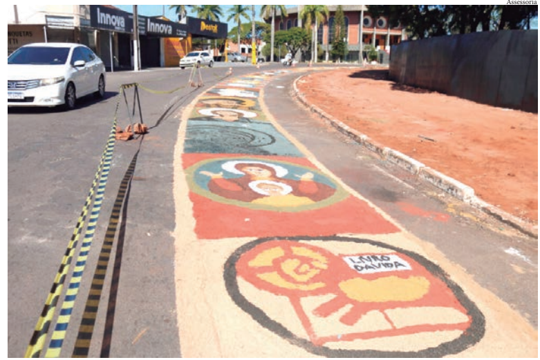
Tapetes de serragem foram confeccionados por centenas de fiéis desde as primeiras horas da manhã

Depois da celebração, a multidão seguiu em procissão pelo tradicional tapete, nas ruas centrais da cidade até chegar à Catedral, para a bênção do Santíssimo.