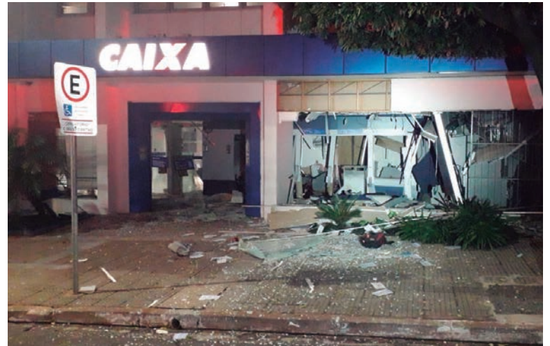
Agência ficou completamente destruída depois da ação marginal na madrugada da quinta-feira

Ainda de acordo com a Polícia Militar, não foi