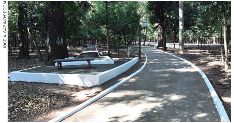
Foi feita a recuperação da pista de caminhada, com eliminação de buracos e outras imperfeições, além de outras benfeitorias

Os serviços exigem baixo investimento, pois são realizados com mão de obra do próprio município e material disponibilizado pela Secretaria