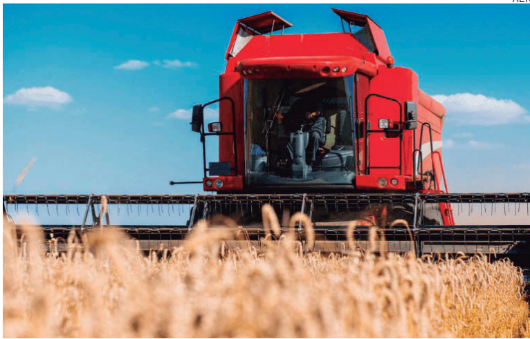
Os solos chamados de Latossolos Vermelhos, reconhecidos como apropriados à produção por demandar menor investimento e alta produtividade

Os solos da região são chamados de Latossolos Vermelhos, reconhecidos como apropriados à produção agrícola porque demandam menor investimento para obterem altas médias de produtividade. Entre as características está a coloração avermelhada e a textura argilosa. A terra vermelha ocupa 32% da área territorial do Estado e responde por 7,2% da produção brasileira. Essa capacidade de produção impulsionou o desenvolvimento de Londrina e região, que abrigou a cultura cafeeira nas décadas de 30 a 70 - pos-