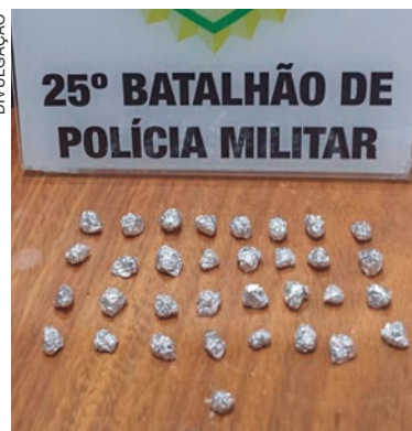
Pedras de crack apreendidas em Umuarama estava com um dos autores da invasão à casa de agente do Depen

Quando o agente notou a chegada dos bandidos, avançou contra um deles, que também notou que se tratava