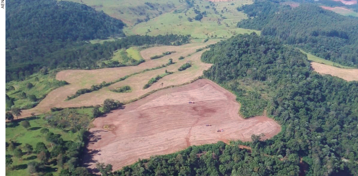
Estado perdeu 4.069 hectares de área com vegetação nativa em 2022, 0,2% do Brasil, ante 7.031 hectares em 2021. Número é inferior a 2020 (5.770 hectares)

O desmatamento diminuiu 42% entre 2021 e 2022 no Paraná, a segunda maior redução entre todos os estados do País, de acordo com o relatório publicado ontem (12) pelo MapBiomas, uma iniciativa do Observatório do Clima. A diferença corresponde a quase 3 mil hectares preservados, reflexo das políticas públicas implementadas a partir de 2019 com foco na educação ambiental, planejamento e repressão qualificada.