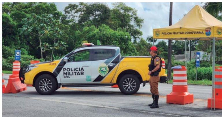
Entre os objetivos da Polícia Rodoviária, estava o combate ao excesso de velocidade, que apresentou ligeira melhora em comparação ao ano anterior