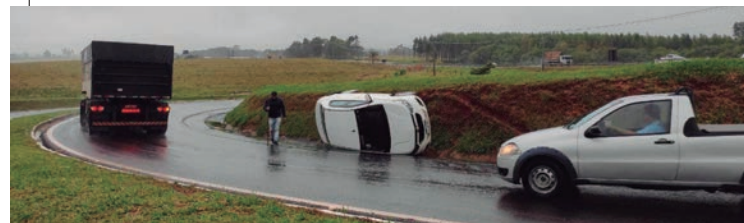
O Chevrolet Cobalt, com placas de Toledo, se envolveu em um acidente de trânsito ontem (segunda-feira, 12), por volta das 9h30. O condutor, de 39 anos de idade, que não teve sua identidade revelada pela Polícia Rodoviária Estadual seguia pela rodovia PR-323, até que fez a conversão, tendo acesso ao entroncamento que faz ligação à rodovia PR-486, quando perdeu o controle da direção. O Cobalt tombou na pista. O motorista não sofreu ferimentos e disse aos patrulheiros que trafegava no sentido a Toledo e, quando chegou ao entroncamento, se perdeu. O tráfego seguiu lento e parcial no trecho que o carro fosse removido.