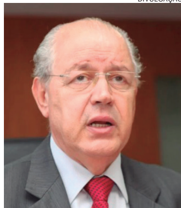
Suplente do Podemos foi confirmado pelo STF como novo deputado paranaense no lugar de ex-procurador

Ele também defendeu a decisão do Supremo de dar a vaga do ex-procurador ao Podemos. “Não, não existe outro deputado na vaga do Podemos. Foi uma interpretação equivocada (do TRE do Paraná). A vaga é do Podemos isso está na Constituição. Não existe voto majoritário nem cláusula de barreira na Constituição. O próprio ministro (Luís Roberto) Barroso confirmou que não há cláusula de barreira para o suplente. Nós tínhamos direito a duas cadeiras”, salienta. “Infelizmente, por uma cláusula de barreira esdrúxula, na primeira chamada eu já perdi a vaga. Nós seguimos a lei, investimos no deputado Dallagnol, o puxador de votos, e o eleitorado do Paraná decidiu dar o voto para o Podemos. Com a decisão do TSE (de cassar Deltan), o Tribunal mandou que os votos fossem computados