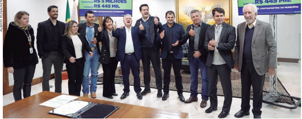
Ratinho Junior assinou contratos com as cidades para dar continuidade ao programa de pavimentação urbana

Mais cinco municípios paranaenses – entre eles quatro da região Noroeste –, concluíram seus projetos e vão receber os recursos do programa Asfalto Novo, Vida Nova para a pavimentação de ruas e iluminação pública. O governador Ratinho Junior assinou ontem (13) os contratos com as cidades de Nova Olímpia, São Jorge do Patrocínio, São João do Caiuá e Perobal, no Noroeste, e Guapirama, no Norte Pioneiro, para dar continuidade aos projetos. Ao todo, o pacote soma R$ 20,6 milhões em investimentos, sendo R$ 256,5 mil de contrapartidas municipais.