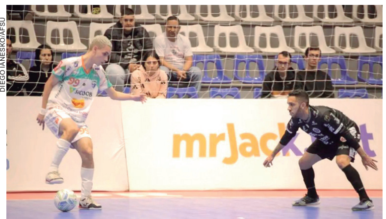
O jogo aconteceu no ginásio de esportes Amário Vieira da Costa, na casa dos umuaramenses

A partida era válida pela 10ª rodada da Liga Nacional de Futsal (LNF) e, com este resultado negativo, a equipe da Capital da Amizade caiu para a 12ª colocação na tabela. O próximo adversário será ainda mais complicado para o Umuarama Futsal. Trata-se do Atlântico de Erechim, que está em 3º lugar no torneio. O confronto será hoje (quarta-feira, 14), às 19h, no Clube Esportivo e Recreativo Atlântico, em Erechim, no Rio Grande do Sul. (Colaboração – Obemdito)