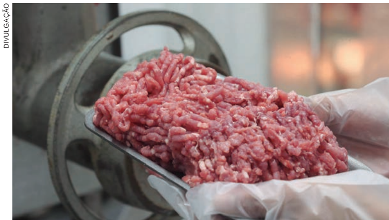
Até salsichas e linguiças perderam importância na mesa do consumidor

Aurelia Vicente destacou que mesmo as proteínas mais baratas, como salsichas e linguiças, que se destacaram em 2022, perderam importância na mesa dos brasileiros na comparação com o primeiro trimestre do ano passado. O consumo de linguiças caiu de 15,4% para 14,9% e o de