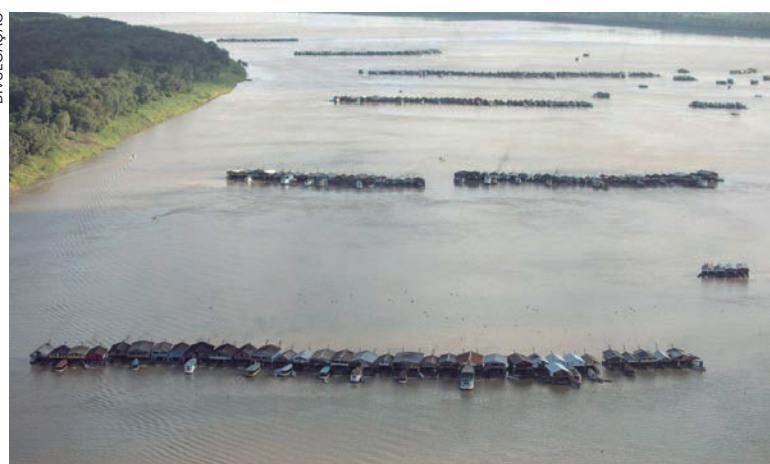
Proposta acaba com a presunção de boa-fé prevista na legislação

“Além de aumentar o rigor do controle dessa cadeia produtiva, a proposta tem entre seus objetivos o estrangulamento das atividades de esquentamento do minério ilegal extraído de territórios indígenas e de unidades de conservação e o fechamento das brechas legislativas