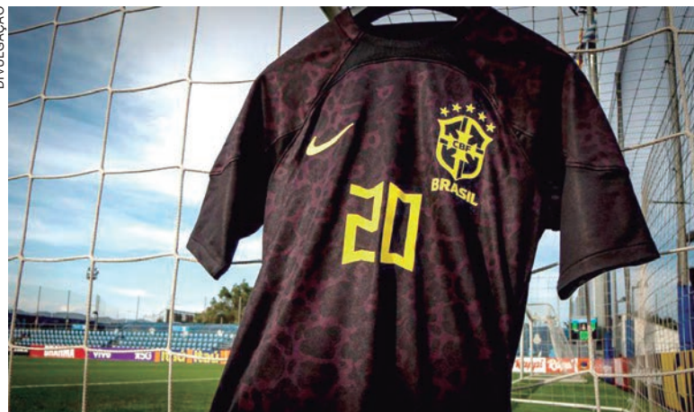
Iniciativa da CBF faz parte de série de ações de combate ao racismo

A decisão da CBF, de firmar posição na luta antirracismo no amistoso na Espanha, foi tomada três dias após o atacante Vinícius Júnior, do Real Madrid, ter sofrido discriminação racial no campeonato nacional da LaLiga. No último dia 21, o brasileiro foi alvo de insultos racistas – na derrota por 2 a 1 para o Valência – pela 10ª vez seguida na competição.