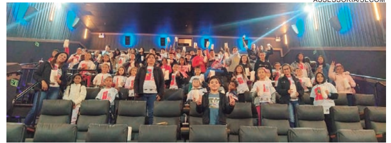
Foram quatro sessões do filme “Homem-Aranha: Através do Aranhaverso”, uma animação muito elogiada pela crítica