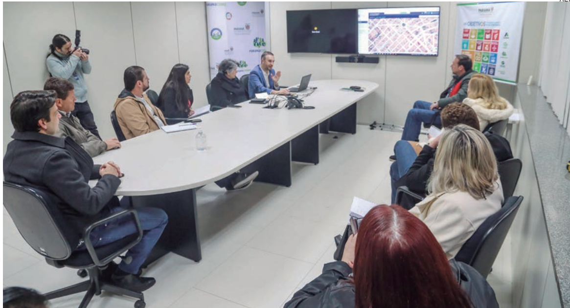
Técnicos de 16 municípios vão passar por um treinamento, para trabalhar com um software de georreferenciamento, adquirido pelo Governo do Estado

Técnicos de 16 municípios do Paraná vão passar por um treinamento, entre segunda e sexta-feira (19 e 23), para aprenderem a trabalhar com um software de georreferenciamento adquirido pelo Governo do Estado. O objetivo é utilizar o equipamento na gestão pública, visando melhorar e facilitar o atendimento à população. Antes disso, ontem (14), profissionais da Secretaria das Cidades (Secid) e do Paranacidade, vinculado à pasta, foram capacitados para lidar com o programa, chamado Sistema de Gestão de Base de Dados Corporativa e Multifinalitária.