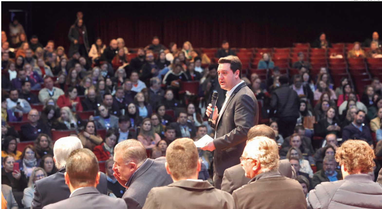
As propostas integram o Educa Juntos e incluem avaliações diagnósticas e formação continuada aos professores alfabetizadores

“Estamos fazendo um grande pacto pela educação nos 399 municípios do Paraná, para trabalharmos juntos para melhorar a aprendizagem das nossas crianças”, afirmou Ratinho Junior. “Nosso compromisso é ter mais instrumentos e ferramentas para aperfeiçoar o corpo técnico e contribuir com todos os municípios. O Estado pode ser parceiro ajudando com o material didático, tecnologias e pensando junto as estratégias para construir uma nova proposta pedagógica nas nossas escolas”.