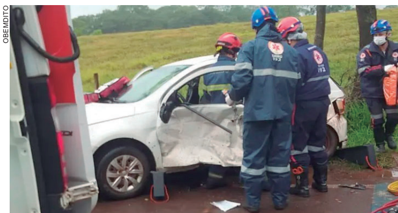
Bombeiros retiraram o motorista ainda com vida das ferragens do Gol, logo após a colisão perto do trevo de acesso à Iporã

Eles retiraram o motorista de dentro do Gol e o levaram para o hospital. Aparentemente o homem não apresentava ferimentos graves, mas estava com respiração fraca e a pancada da colisão poderia ter causado ferimentos internos. Após dar entrada no hospital a vítima não resistiu.