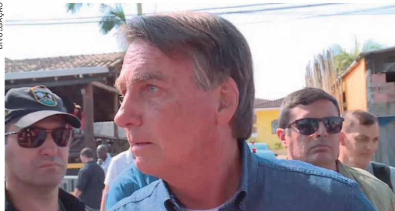
Em função da multa, valores que estavam na conta ou que serão depositados serão retidos devido ao bloqueio judicial, que já é o segundo aplicado ao ex-presidente

“Por enquanto tenho fundo, daqui a pouco não vou ter mais.