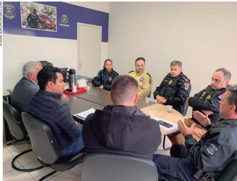
Reunião serviu para discutir questões relacionadas à integração entre as instituições e a reativação do Gabinete de Gestão Integrada da Segurança

membros convidados tanto do setor público quanto da sociedade civil organizada.