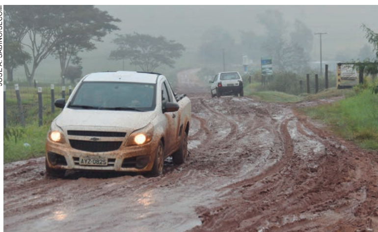
Como a chuva foi contínua, dia e noite desde a segunda-feira, a água se acumulou e com a passagem de veículos formou-se muita lama, dificultando o tráfego

Como a chuva foi contínua, dia e noite desde a última segunda-feira, a água se acumulou em diversos pontos e com a passagem de veículos formou-se muita lama, dificultando o tráfego. “Várias estradas foram comprometidas, como a Pioneiro (que liga ao distrito de Lovat), Mandaguara, Amarela, Vermelha, Pavão, Paulista,