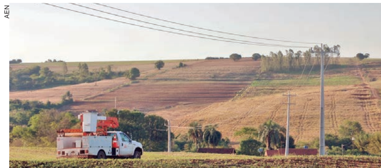
A companhia aplica neste ano R$ 289,34 milhões na região, o que representa 16% do total de R$ 1,8 bilhão que já está sendo investido

A maior parcela é destinada ao Paraná Trifásico. Em 2023 o programa está recebendo R$ 91,85 milhões para ampliar a malha de redes trifásicas, que